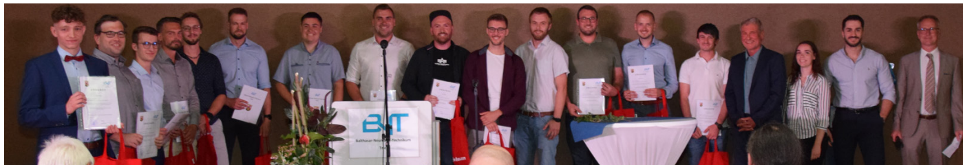
Abschlussfeier am kreiseigenen Balthasar-Neumann-Technikum: Das Foto zeigt die Klassenbesten

Umfassende Informationen aller technischen Fachrichtungen zu(r)m Staatlich geprüften Techniker:in an der Schule des Kreises gibt es unter www.bnt-trier.com oder Tel. 06519180010.