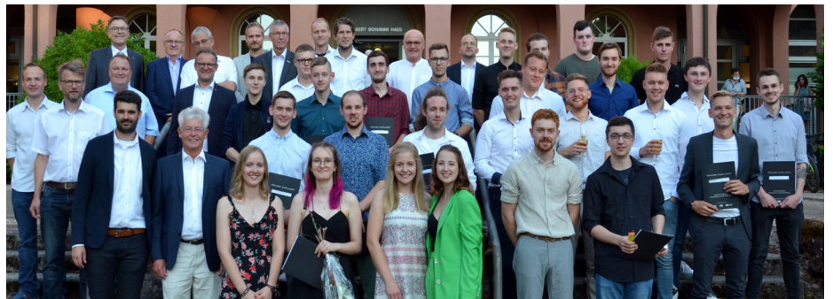
Die neuen Gesell:innen wurden gefeiert. Das Foto zeigt sie zusammen mit den Gästen.

Die Prüfungsbesten und Gewinner des Kreativ-Wettbewerbs DIE GUTE FORM erhielten als Anerkennung Sach- und Geldpreise im Gesamtwert von 1.200 Euro von den Sponsoren und Unterstützern Hees + Peters, Leyendecker Holzland sowie der Volksbank.