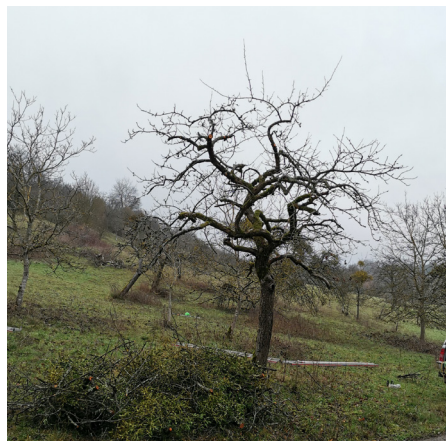
Die Bilder zeigen denselben Baum - einmal mit Mistelbefall und einmal nach Entfernen der Misteln.