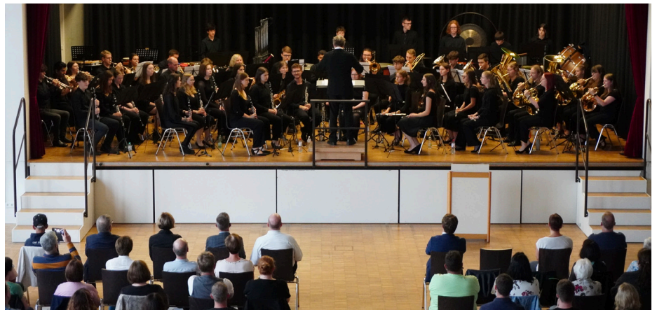
Das Kreisjugendorchester präsentierte sich vor vollem Haus im Schweicher Bürgerzentrum.

Die gute Klangqualität, die umsichtige Intonation und der ausgewogene Gesamtklang verdeutlichten die musikalische Entwicklung in der vorausgegangenen einwöchigen Sommerarbeitsphase. In Prüm hatten sich die Jugendlichen gemeinsam mit verschiedenen Dozentinnen und Dozenten auf das Konzert vorbereitet. In der profes-