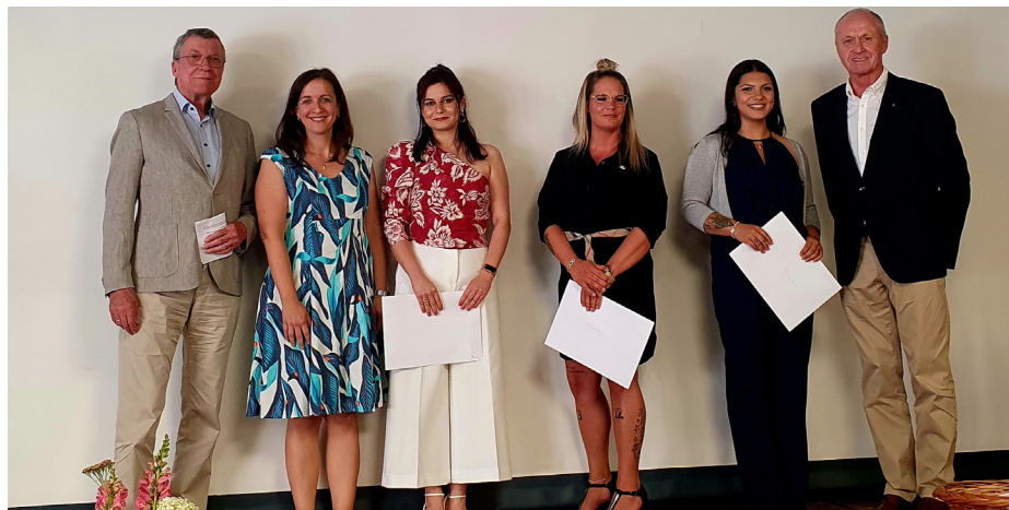
Drei Absolventinnen der Pflegefachschule erhielten Preise vom Lions Club für ihre besonderen Leistungen.