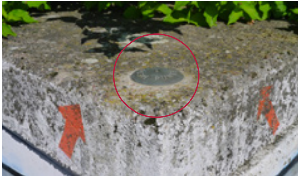
GPS-Vergleichspunkt vor dem Eingang des Eduard-Spranger-Gymnasiums Landau in der Pfalz, Schneiderstraße 71

methode ortet man dabei unterschiedlich genau. Für alle diejenigen, die die Genauigkeit ihres GPS-Gerätes überprüfen möchten, bietet die Vermessungs- und Katasterverwaltung Rheinland-Pfalz jetzt einen neuen Service.