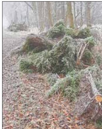
Ablagerungen direkt vor dem ehem. Steinbruch

Aber anstatt den Grünschnitt ordnungsgemäß zu entsorgen oder nachzufragen, ob diese auf der Sammelstelle im ehemaligen Steinbruch angeliefert werden kann, wird der Abfall einfach am Wegesrand im Wald entsorgt. 20 Meter von der Grünschnittsammelstelle entfernt. Dabei geht es nicht um eine Schubkarre voll Grünschnitt. Hier sind mehrere Hänger voll an zwei Stellen illegal abgeladen worden. Bei dieser Aktion handelt es sich nicht um einen „dummen-Jungen-Streich“, sondern um eine Ordnungswidrigkeit, die finanzielle Konsequenzen nach sich ziehen kann.