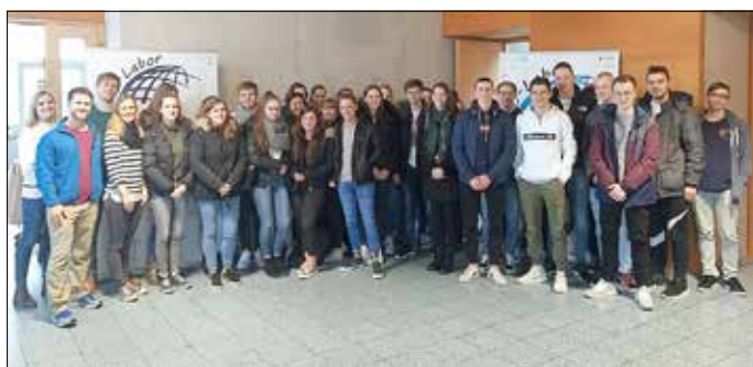
Schülergruppe am GIS

Eine zentrale Kompetenz ist das Verstehen und Analysieren thematischer Karten im Erdkundeunterricht und die daraus resultierenden Erkenntnisse, um raumbezogene Fragestellungen zu bearbeiten. Hierfür konnte durch die Einheit der Mitarbeiter des GIS-Labores, welche alle Lehramtsstudenten im Fach Geographie sind, ein tieferes Verständnis geschaffen werden.