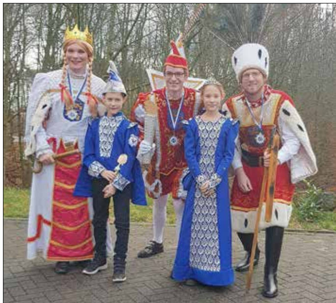
Kinderprinzenpaar des KVN und das RKV Dreigestirn