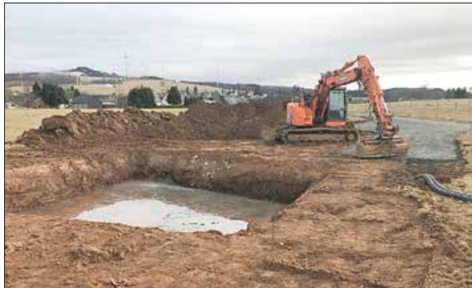
Fundamentbau für den Mobilfunkmast

Seit 20.01.2020 sind die Baumaschinen im Einsatz, um den Mobilfunkmast am Ortsrand von Hof zu errichten. Hierdurch soll die Abdeckung des Mobilfunknetzes, insbesondere im D1-Netz in Hof verbessert werden. Hiermit geht Hof einen weiteren digitalen Schritt und verbessert den Handypfänger in Hof.