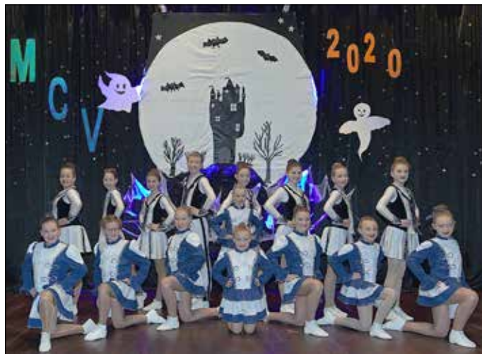
Prinzengarde und Minigarde

blieb auch das letzte Auge nicht mehr trocken. Unser Männer-Ballett M.I.B. brachte gleich zwei Beiträge mit. Ging es im ersten noch um einen Mix aus „Twilight, Schwanensee und Sponge Bob“, zeigten sie im zweiten als Nonnen aus „Sister Act“ ihr Können.