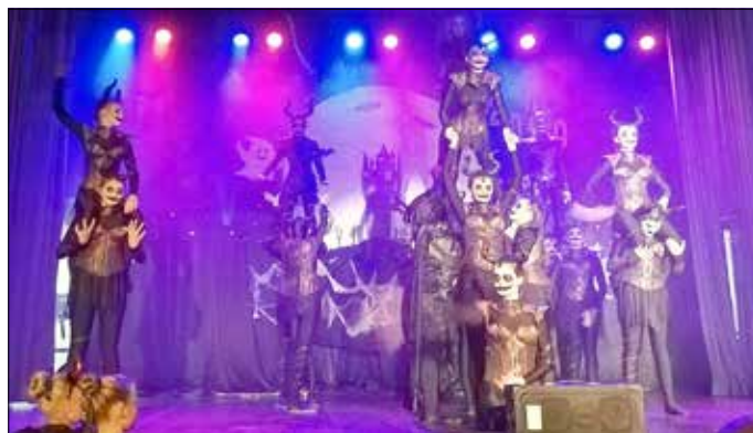
The Tomorrow People