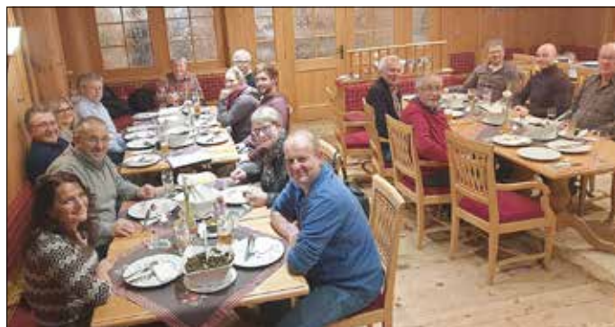
Der Jahreszeit entsprechend, gab es zum Schluss der informativen Veranstaltung noch ein leckeres Grünkohlessen für den Förderverein und den Stadtrat.

Am Samstag den 25.1.2020 folgten zahlreiche Vertreter des Stadtrates Bad Marienberg der Einladung des Förderverein Wildpark zum Neujahrsempfang.