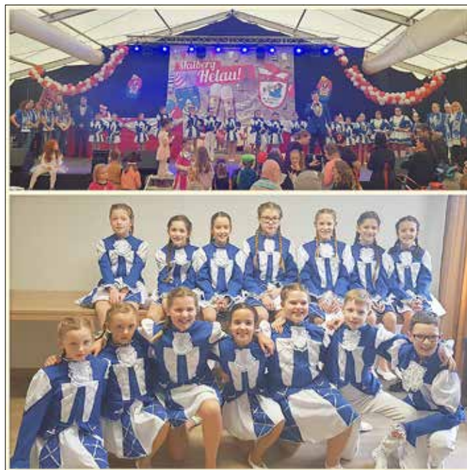
Oben: Alle Aktiven bei der KG Malberg & unten: die Kindergarde