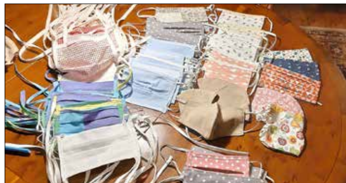
Ein Teil der gefertigten Mundschutzmasken