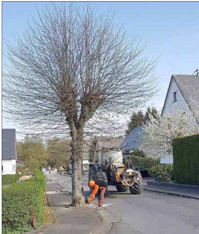
Die „letzte Linde“ der Lindenstraße wird gefällt

Somit haben wir (vorerst) eine Lindenstraße ohne Linden, bzw. nur noch „Lindenstümpfen“.