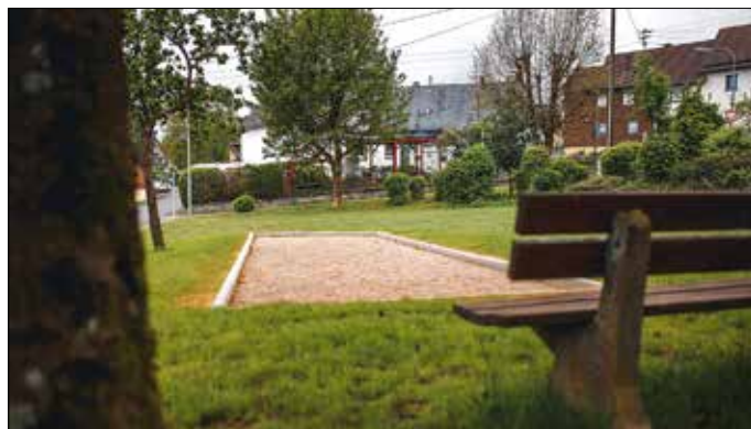
Bouleplatz Hardt (F. Schmidt)