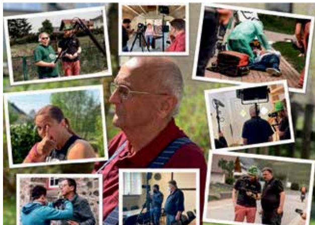
Screenshots von den Pandemie-Dreharbeiten.