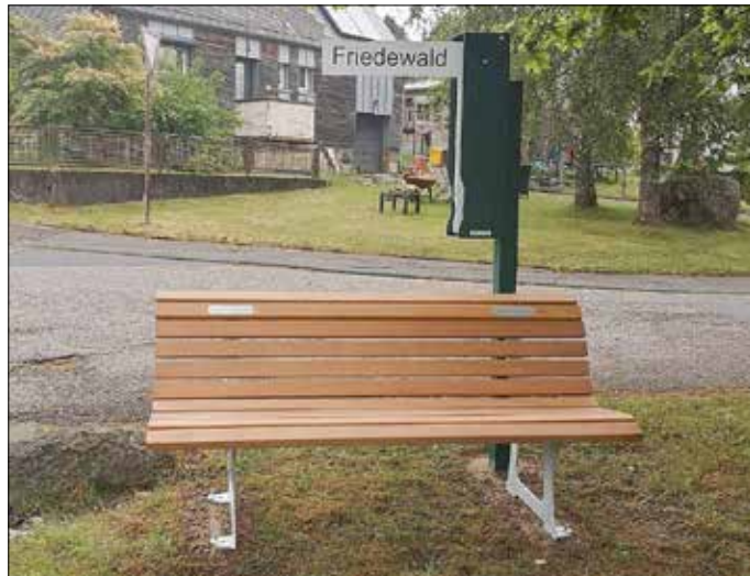
Bank an der Eiche-Hauptstraße

Da unser Ort am Rande zur Verbandsgemeinde Daaden liegt, bot sich auch nach Absprache mit dem Kreis Altenkirchen für Langenbach die Gelegenheit, an der Aktion teilzunehmen.