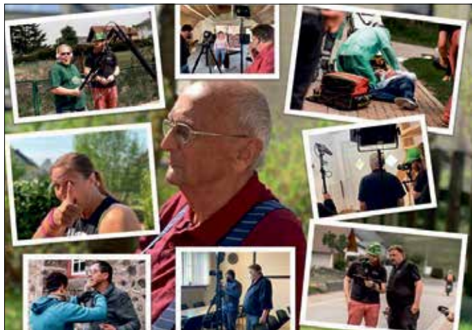
Screenshots von den Pandemie-Dreharbeiten.