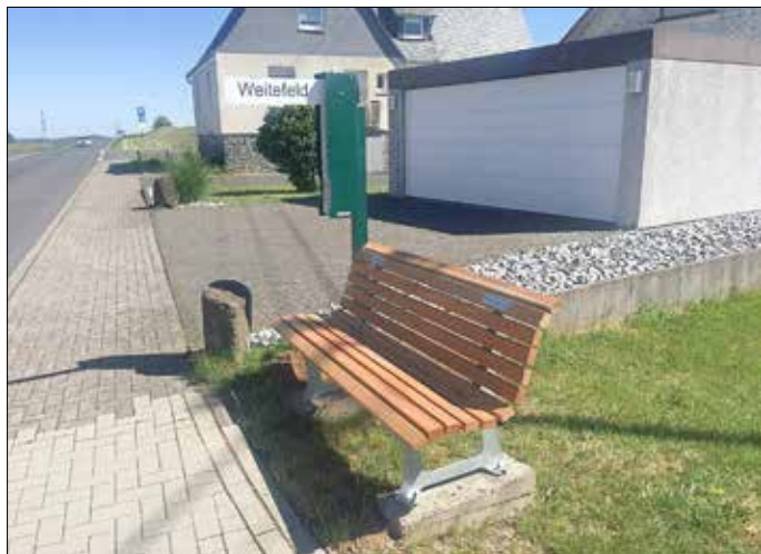
Bank an der Betzdorfer Straße

Unter anderem ist auch die Verbandsgemeinde Daaden dabei.