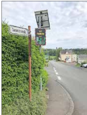
Das neue Messgerät im Einsatz

Das alte elektronische Messgerät war mehr als 10 Jahre in Flottstraße und Talstraße im Einsatz. Entsprechende festverbaute Haltvorrichtungen an Masten ermöglichten einen schnellen wechselseitigen Einsatz in diesen Straßen. Nachdem das Gerät vor einigen Wochen wiederum zum Wechsel in die Talstraße versetzt wurde, zeigten sich Funktionsstörungen, die