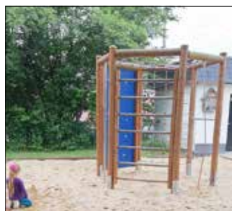
Neuer Sand in der Grube

Die Erzieherinnen unserer Kita Villa Sonnenschein haben die Zeit der Notbetreuung im Zuge der Corona-Pandemie genutzt, um den Spielplatz auf dem Außengelände „auf Vordermann“ zu bringen. Mit viel Engagement wurden die Tische und Bänke gestrichen, die Spielgeräte abgewaschen und die Sandkästen gesäubert und mit neuem Sand aufgefüllt.