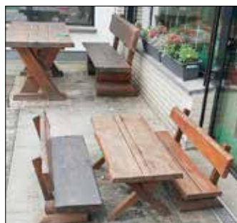
Neuer Anstrich für Tische und Bänke

Außerdem wurde das Außengelände einer kompletten Grundreinigung unterzogen. Hierbei haben auch die Kinder fleißig geholfen, die sich bei schönem Wetter freuen können, auf dem Spielplatz zu spielen und zu toben.