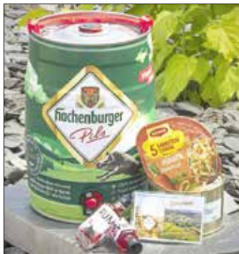
Das ist drin

Da die allseits beliebte Kirmes in Fehl-Ritzhausen nicht stattfinden darf, könnt ihr euch ein bisschen Kirmes-Feeling nach Hause holen. Dafür packen wir euch die Kirmes in einen Karton.