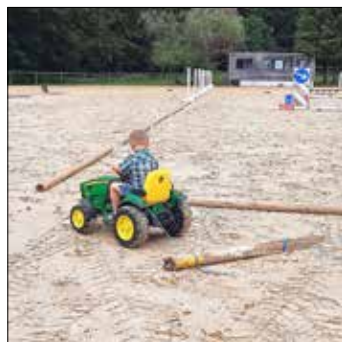
Groß und Klein packten beim diesjährigen Helfertag mit an.

Wir sind stolz in diesen Zeiten zum 55-jährigen Jubiläum des RZfV Oberwesterwald das alljährliche Springturnier vom 03.-05. Juli 2020 auszurichten. Natürlich unterliegt auch unser Turnier den hohen Anforderungen der Sicherheits- und Abstandsregeln, die an den Turniertagen durch die Reiter und Helfer zu befolgen sind. Wir sind besonders traurig, dass das Turnier in diesem Jahr ohne Zuschauer stattfinden muss. Die Prüfungen können dafür jedoch erstmals über www.clipmyhorse.tv kostenlos im Livestream verfolgt werden.