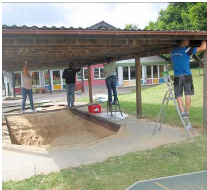
Fleißige Helfer am Kindergarten

Zwar sind wir noch nicht im Regelbetrieb angekommen, aber so langsam kehrt wieder Leben in unsere KITA.