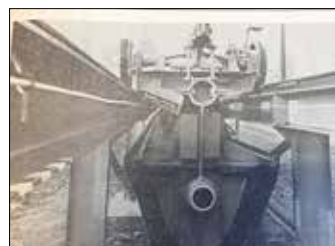
(li.) Zug mit Fahrwerk auf Rollen und (re.) Trogförmiges Gummiband eingehängt am Rollen-Fahrwerk des Zuges