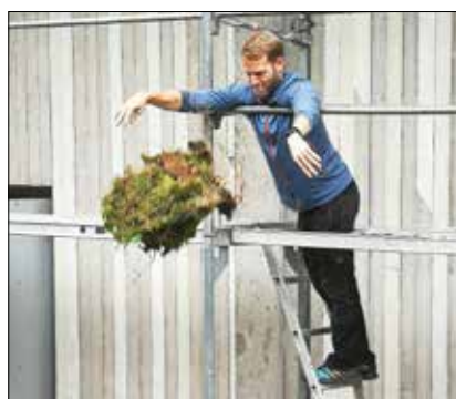
„Fallversuch mit verpacktem Ei“.

Anschließend standen der Wald und seine Tiere im Mittelpunkt der Aufmerksamkeit. Insekten und andere wurden Tiere gesucht und begutachtet. Im nächsten Spiel stellte sich heraus, dass man ein Ei so mit Naturmaterialien verpacken kann, dass es sogar bei einem Wurf aus großer Höhe nicht kaputt geht. Hier war Kreativität, Experimentierfreudigkeit und vor allem Teamabsprachen gefragt. Der Jubel war groß, als das Ei nach dem „Aufprall“ meist heil aus der Verpackung genommen werden konnte.