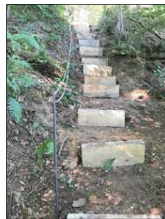
Stufenanlage nach Umbau

Da sich die Ortsgemeinde Unnau der Bedeutung dieses uberortlichen Wanderweges fur alle Wanderer von nah und fern bewusst ist, wurde das fur die Reparatur benotigte Material in Form von Holz und den Kettenhandlauf seitens der Ortsgemeinde Unnau kostenlos und unburokratisch zur Verfugung gestellt und somit letztlich auch der heimische Tourismus unterstutzt.