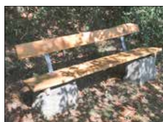
Neu hergerichtete Bank

Da sich die Ortsgemeinde Unnau der Bedeutung dieses uberortlichen Wanderweges fur alle Wanderer von nah und fern bewusst ist, wurde das fur die Reparatur benotigte Material in Form von Holz und den Kettenhandlauf seitens der Ortsgemeinde Unnau kostenlos und unburokratisch zur Verfugung gestellt und somit letztlich auch der heimische Tourismus unterstutzt.