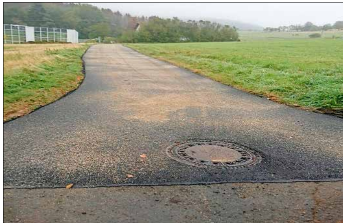
Asphaltierter Wirtschaftsweg oberhalb der Firma Hain in der Gemarkung Korb

Wie sicherlich vielen Bürgerinnen und Bürgern schon aufgefallen ist, wurde der Wirtschaftsweg oberhalb der Firma Hain in der Gemarkung Korb asphaltiert. Der schlechte Zustand des Weges wurde bereits seit vielen Jahren bemängelt.