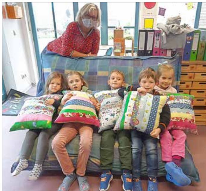
Manche Mama nähte zum ersten Mal, aber alle konnten am Ende ein tolles Ergebnis präsentieren.