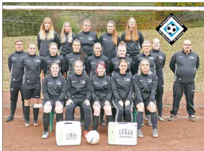
Die Damenmannschaft der SG Alpenrod / Kirburg mit den neuen Utensilien

Die in Nistertal ansässige Apotheke sponserte den Mädels einen Eiskoffer, sowie einen top ausgestatteten Betreuerkoffer für kleine Blessuren und Verletzungen auf und um den Platz während des Spiel- und Trainingsbetriebs.