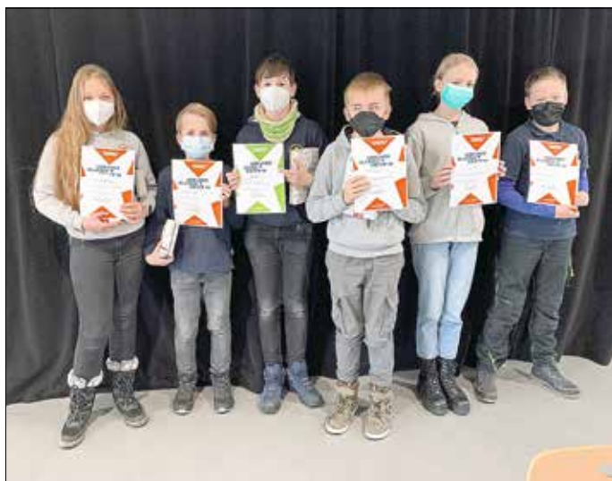
Finalteilnehmer des Vorlesewettbewerbs