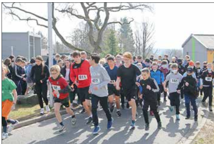
Lehrer und Schüler laufen gemeinsam

Die Schulgemeinschaft ist stolz auf den geleisteten Beitrag, welcher hoffentlich das Leid der Menschen in der Ukraine ein wenig lindern kann.