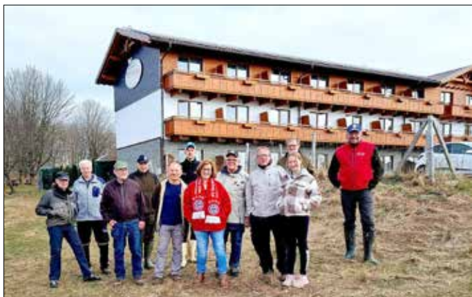
Fanclub-Gruppe nach getaner Arbeit