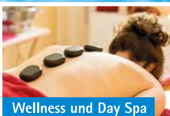
Wellness und Day Spa