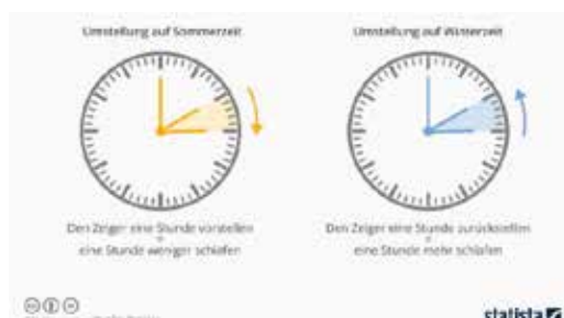
Abbildung: Zeitumstellung Sommer- und Winterzeit

Kommendes Wochenende ist es endlich wieder soweit: Die Uhr wird auf Sommerzeit umgestellt, die warme Jahreszeit steht damit schon vor der Tür. Wir freuen uns schon jetzt auf das morgendliche Wachküssen der Sonne sowie schöne, lange Sommerabende im Freien. Doch wieso gibt es überhaupt eine Sommer- und Winterzeit? Aus welchen Gründen stellen wir die Uhr jedes Mal zum Jahreszeitenwechsel um?