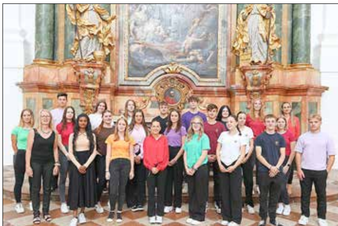
Chor des EvGBM

Da sich die Kollegienkirche mitten in der Altstadt von Salzburg befindet und als beliebtes touristisches Ziel (UNESCO-Welterbe) für jedermann zugänglich ist, lockten bereits die ersten Proben vor Ort viel neugieriges Publikum aus aller Welt an, sodass diese beinahe unter Konzertbedingungen stattfinden konnten. Hier bekam der/die ein oder andere schon eine erste Ahnung davon, was es heißt, Lampenfieber zu bekommen, da es galt, sowohl der altherwürdigen Atmosphäre des Ortes als auch der freudigen Erwartung des Publikums entsprechend gerecht zu werden.