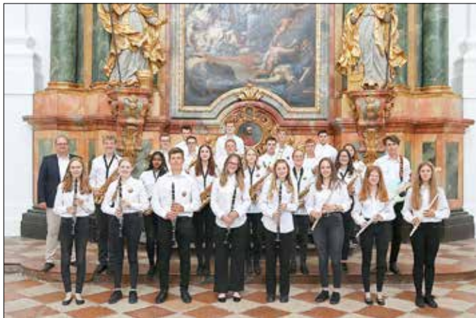
Swing-Combo des EvGBM

Diese Aufführung fand dann an keinem geringeren Ort als der prunkvollen Kollegienkirche - von den Salzburgern ob des hellen Stuckwerks nur „die Weiße“ genannt - statt, was dem Konzert nicht nur einen angemessenen Rahmen geben, sondern die Leistung der Schüler/-Innen auch entsprechend würdigen sollte.