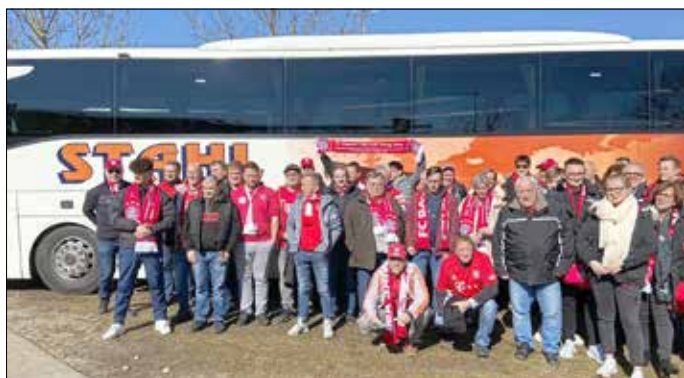
Fans zum Heimspiel des FCB in München.

Als die Coronazeit auch den Fanclub lähmte und auf Dauer einen Stadionbesuch ausschloss, wurde die Idee der „Unterstützung“ unseres kranken Waldes geboren und durch viele begeisterte Fans, die sich umso mehr über die ersten Fan-Kontakte freuten, umgesetzt.