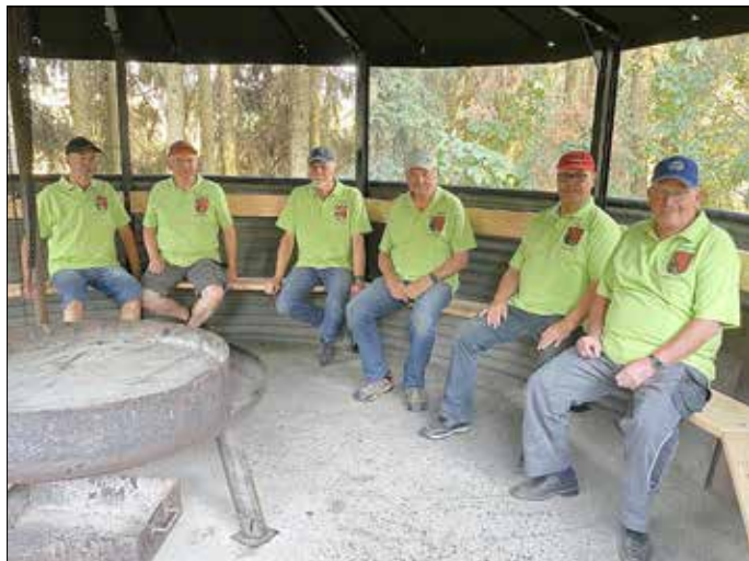
Der Seniorenbauhof in ihren neuen Arbeitspolohemden nach getaner Arbeit

Nun wurde im nächsten Schritt die Bretterverkleidung, die doch schon sehr in die Jahre gekommen war, komplett entfernt und durch eine neue Bretterverkleidung ersetzt. Im Anschluss daran wurde die obere Kante noch durch eine Eigenkonstruktion des Seniorenbauhofes geschützt. Abschließend wurde noch der Austausch der Sitzbänke vorgenommen.