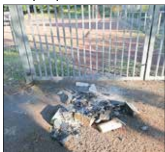
Zündeln vor dem Tor des Sportplatzes

Nachdem ich bereits in der vorletzten Ausgabe des Wäller Blättchens auf das illegale Züngeln an verschiedenen Orten in Hof hingewiesen hatte, ereignete sich vor dem großen Tor am Sportplatz erneut ein solcher Vorfall.