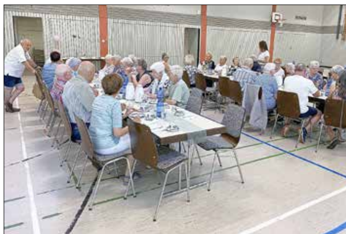
Teilnehmende der Ü60-Teeparty