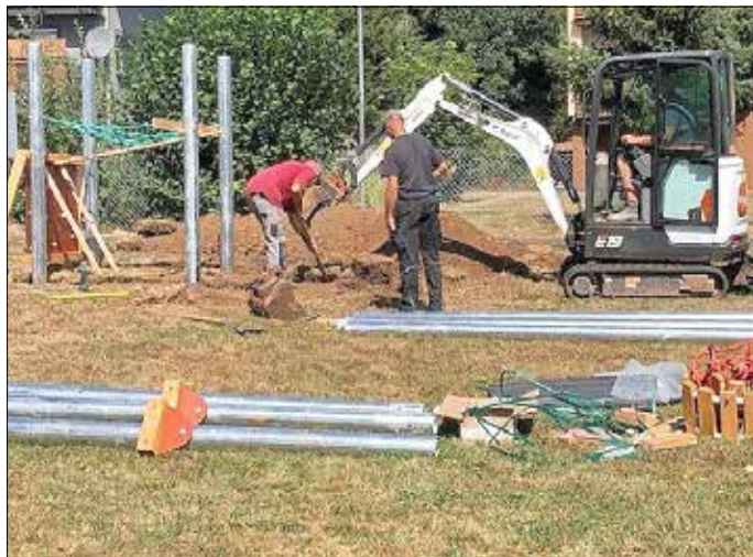
„Während der Einbauphase“