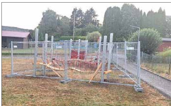
„Fertiggestelltes Spielgerät gesichert durch Bauzaun“