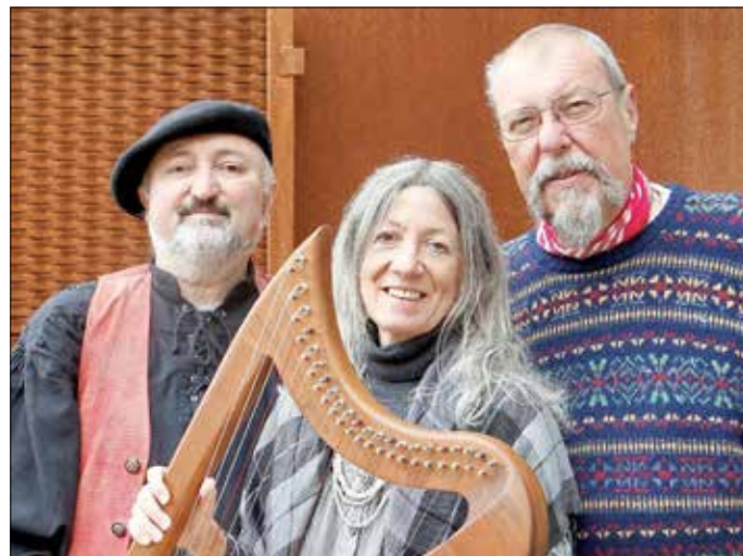
© Shamrock Duo und Rolf Henrici

Platzreservierungen bitte unter Tel.: 02661 / 20329 (Fuhs / Henrici, auch Anrufbeantworter) oder Email: inkunabel@gmx.de