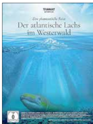
Plakat (C) TANNAT Naturfilme

Hierzu sind nicht nur Mitglieder herzlich eingeladen. Der Eintritt ist frei.