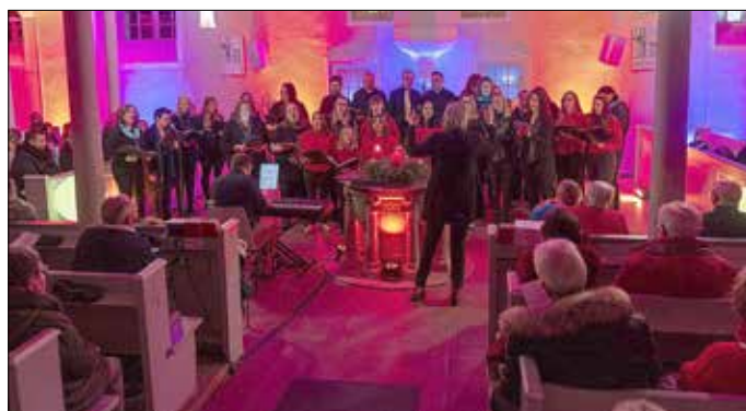
Die Chöre des GSV Fehl-Ritzhausen beim Abschluss-Lied