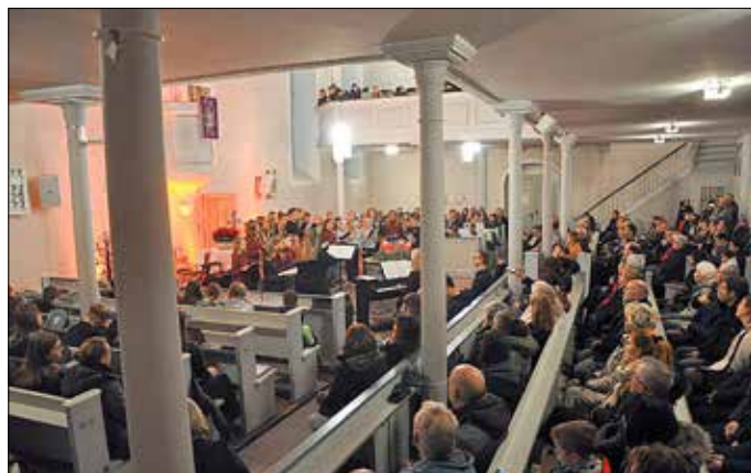
Fun-Chor in voller Kirche

Auch ein politischer Akzent wurde am Ende von der Band-AG gesetzt, die John Lennons „Happy Christmas - War is over!“ vortrug. Der darin enthaltene Aufruf zur Einheit mündete in das von allen - Sängerinnen, Sängern und Publikum - gemeinsam gesungene Abschlusslied „Es ist ein Ros entsprungen“. Die gesungenen Zeilen „mit seinem hellen Scheine vertreibt's die Finsternis“ entsprachen an diesem Abend ganz sicher der Wahrheit - zu hoffen bleibt, dass auch die übrige Finsternis sich auf diese Weise vertreiben lässt.