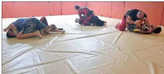
Luta Livre - Training in der Sportschule Westerwald

An dieser Stelle noch einmal Glückwunsch zum verliehenen Schwarzgurt und ein großes Dankeschön für die ehrenamtliche Arbeit an Wotan Engels vom gesamten Vorstand der Sportschule Westerwald e.V. im Namen aller Mitglieder.