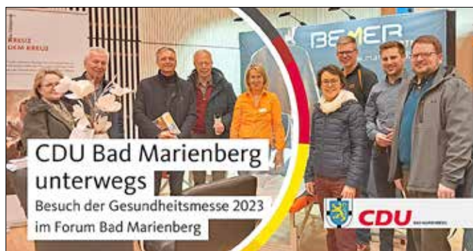
Die CDU Bad Marienberg besuchte am 26.02.2023 die Gesundheitsmesse im Forum (Schulzentrum) Bad Marienberg