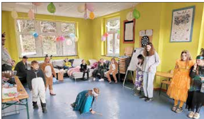
Die jungen Faschingsfans beim Topfklopfen