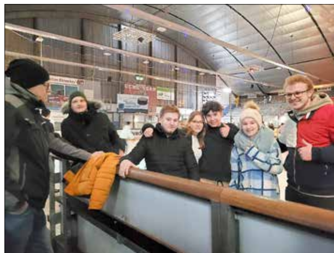
Einige Teilnehmende der Gruppe mit Daumen hoch für die Fun-Night der Eisporthele Diez

Eine Fahrt zur Fun-Night am Samstag, den 25.02. in die Eisporthele Diez bildete den Abschluss der Aktionen im Februar. Abends bei angesagter Musik und tollen Lichteffekten machte das gemeinsame Schlittschuhlaufen besonders viel Spaß. Diese Fahrt war, wie schon seit vielen Jahren, eine gemeinsame Veranstaltung mit der Jugendpflege Hachenburg.