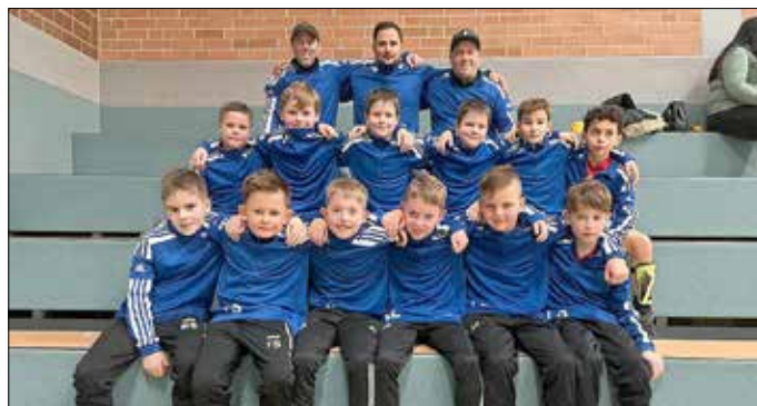
die erfolgreiche Mannschaft mit den stolzen Trainern!!

In Westerburg erreichten wir den 2. Platz beim BMW-Wüst-Cup. Zum Abschluss der Hallensaison nahmen wir beim Weyerbuscher SSV-Hallen-Cup in der Großsporthalle Altenkirchen teil! Auch hier belohnten wir uns für eine sehr starke Mannschaftsleistung mit dem 1. Platz und dem damit verbundenen Turniersieg!