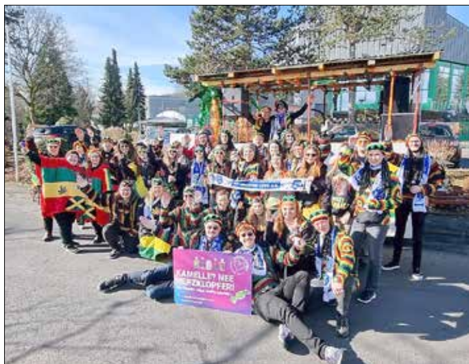
Rosenmontagszug in Rennerod

Dieses Jahr nahmen wir mit dem Thema „Reggae“ am Rosenmontagszug in Rennerod und am Veilchendienstag in Langenhahn teil und verteilten Süßigkeiten an das närrische Volk am Straßenrand.