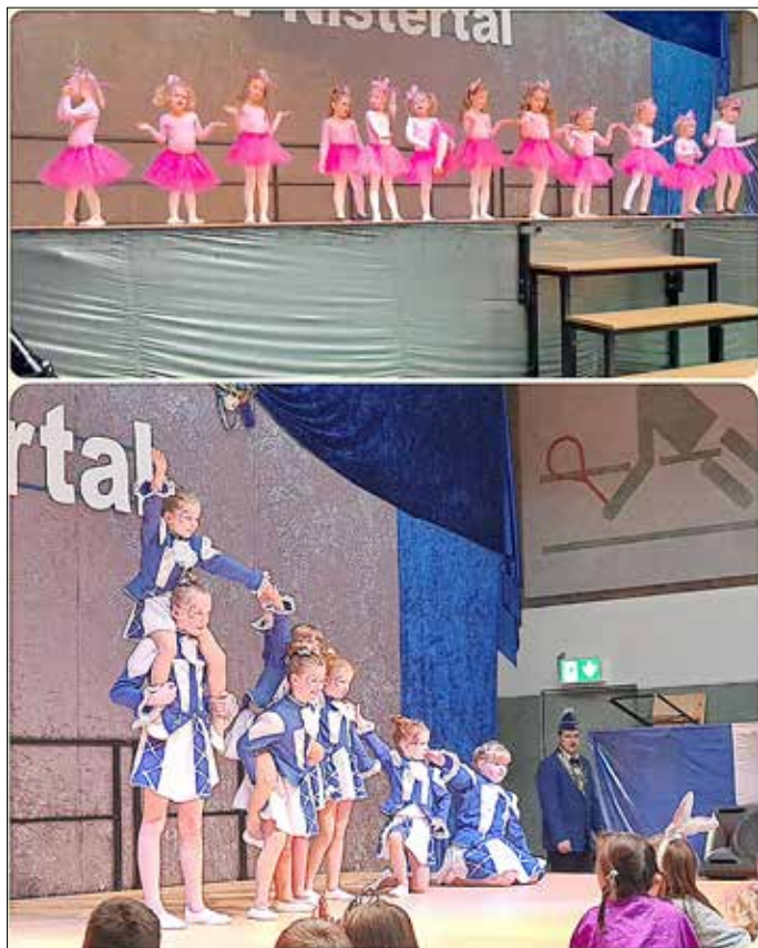
Die Tanzmäuse als Flamingos und die Kindergarde

Die jüngste Garde der blau-weißen Funken überraschte alle mit einem quirligen, beeindruckend vorgeführten Gardetanz und mit fantastischen Hebefiguren.