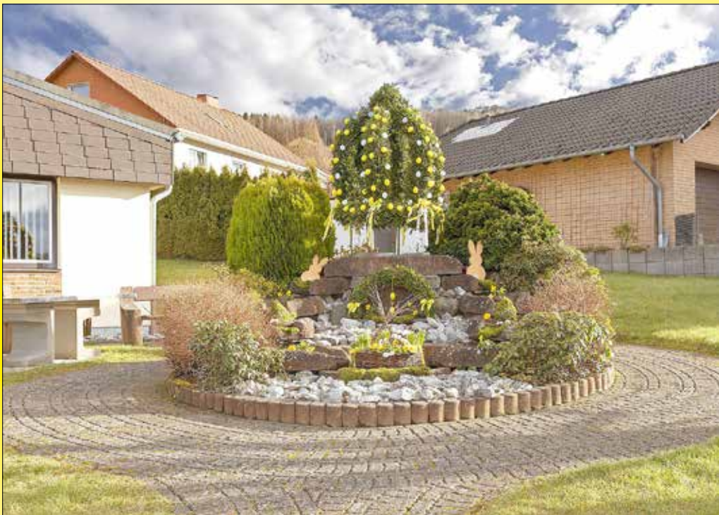
Osterkrone in Hahn bei Marienberg