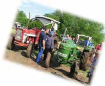
Fahrerlager mit Stromversorgung