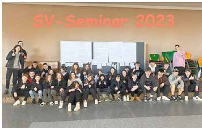
Das SV-Team der Marie-Curie-Realschule plus Bad Marienberg