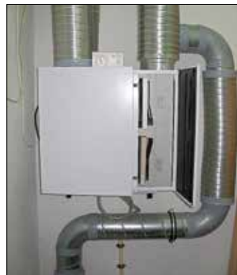
Lüftungsgerät mit zusätzlicher Wärmerückgewinnung