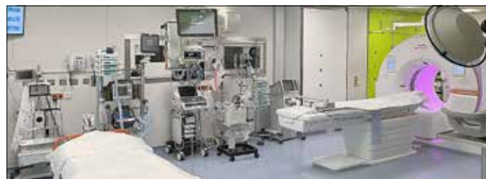
Blick auf einen Behandlungsplatz

Der Dank gilt allen am BwZK die dazu beigetragen haben, den Nachmittag zu einem unvergesslichen Erfolg zu machen, von den organisierenden Ärzten über die Pflegedienstleitung, Notfallsanitäter und Mitarbeiter des „Helicopter Medical Emergency Service“, der Flugrettung. Gut, dass es Sie gibt.