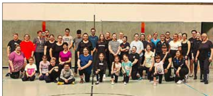
Alle Teilnehmer des Workshops

Am Samstag, 13.5.23, veranstaltete der Karnevalsverein einen Tages- Tanzworkshop mit vielen verschiedenen Angeboten für die Mitglieder. Vom Aufwärmtraining, Rhythmusschulung für die Kinder, Ausdruck & Spannung bis hin zu Garde- und Showtanzschritte war für jeden was dabei. Der Vorstand bedankt sich bei allen Teilnehmern und den Helfern.