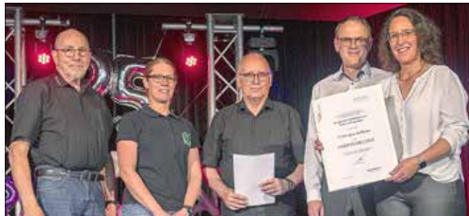
Überreichung der Ehrenurkunde für den Kinder- und Jugendchor Fehl-Ritzhausen durch den CV WW