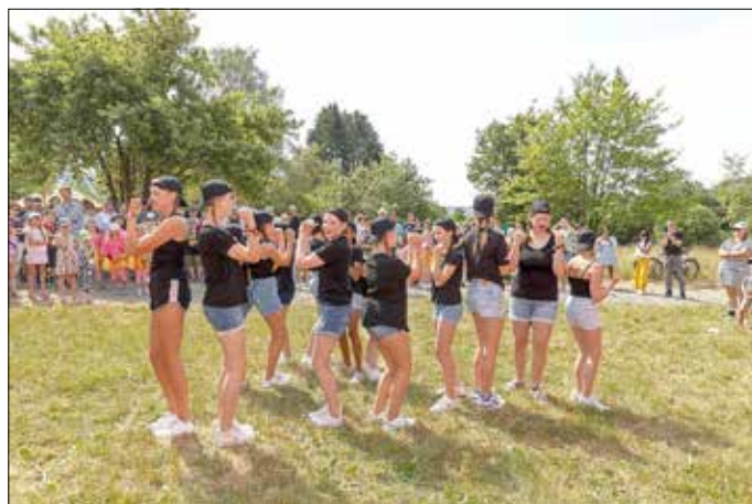
Die Fire Girls bei ihrem Auftritt

Ein Ort lebt von Dorfgemeinschaft und genau das erhoffen wir uns von dem neu erschaffenen Platz namens KESPA , was für Kinder, Eltern, Erwachsenen und Seniorenplatz steht. Es soll eine Begegnungsstätte zwischen Jung und Alt und für alle drei Ortsteile werden, deshalb haben wir auch die zentrale Lage Am Hocker gewählt, so dass der Platz aus allen drei Ortsteilen gut zu erreichen ist.