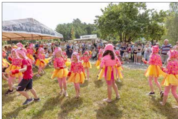
Die Star Kids bei ihrem Auftritt

Um hier eine Verbindung zwischen den Altersgruppen zu schaffen, wurde eine Boulebahn und in unmittelbarer Nähe zur Boulebahn eine Sitzfläche mit drehbaren Holzliegen geschaffen. In der nördlichen Ecke des neuen Platzes soll ein Mehrzweckspielfeld als Rasenfläche mit zwei Fußballtoren künftig zum Fußballspielen und für alle anderen Freiluftsportarten (Federball, Volleyball etc.) dienen.