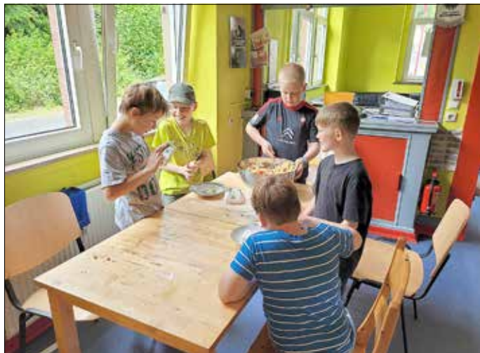
Jungs in ihrem Element: Früh übt sich, wer mal Feinschmecker werden will.

Auch an diesem Tag durfte, wie in der ersten Ferienwoche, das bei diesem schönen Sommerwetter zur Abkühlung unbedingt benötigte Eis nicht fehlen.