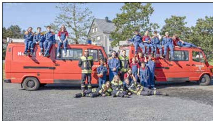
Jubel-Jugendfeuerwehren in voller Personenstärke