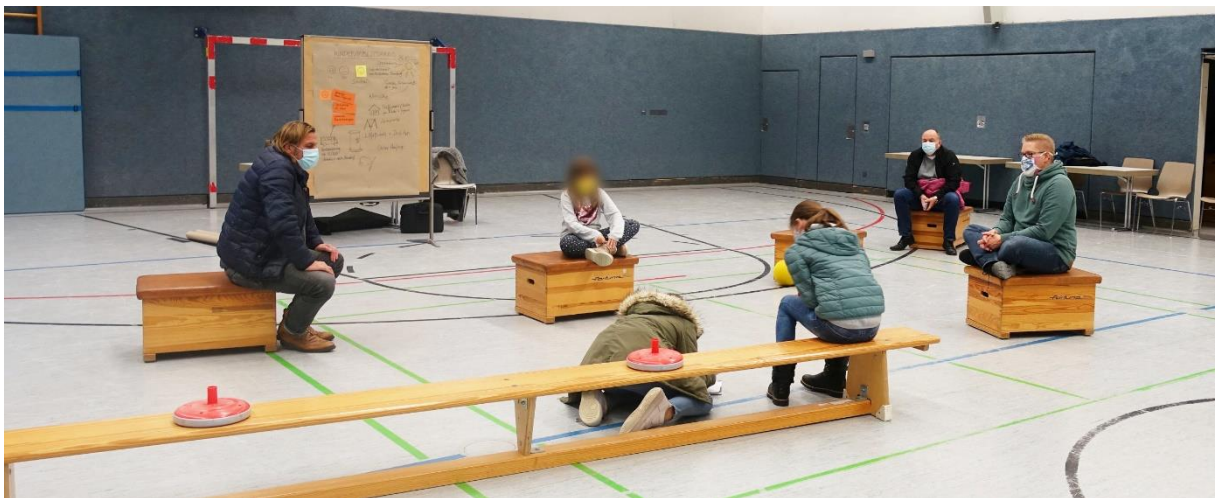
Wenige, aber trotzdem interessierte Kinder im Arbeitskreis

Eigentlich war ein Spaziergang mit den Kindern geplant, um deren Lieblingsorte kennenzulernen. Außer „Zuhause“ fiel den Kindern jedoch kein interessanter Ort ein, den sie den Moderatoren zeigen wollten, so dass der Arbeitskreis ausschließlich in der Halle stattfand.