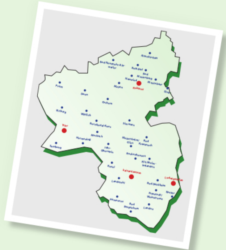
Alle Standorte der Krebsgesellschaft Rheinland-Pfalz e.V.

Krebsgesellschaft Rheinland-Pfalz e.V. Löhrstraße 119, 56068 Koblenz Tel.: 02 61 / 96 38 87 22 vorsorgen@krebsgesellschaft-rlp.de www.krebsgesellschaft-rlp.de