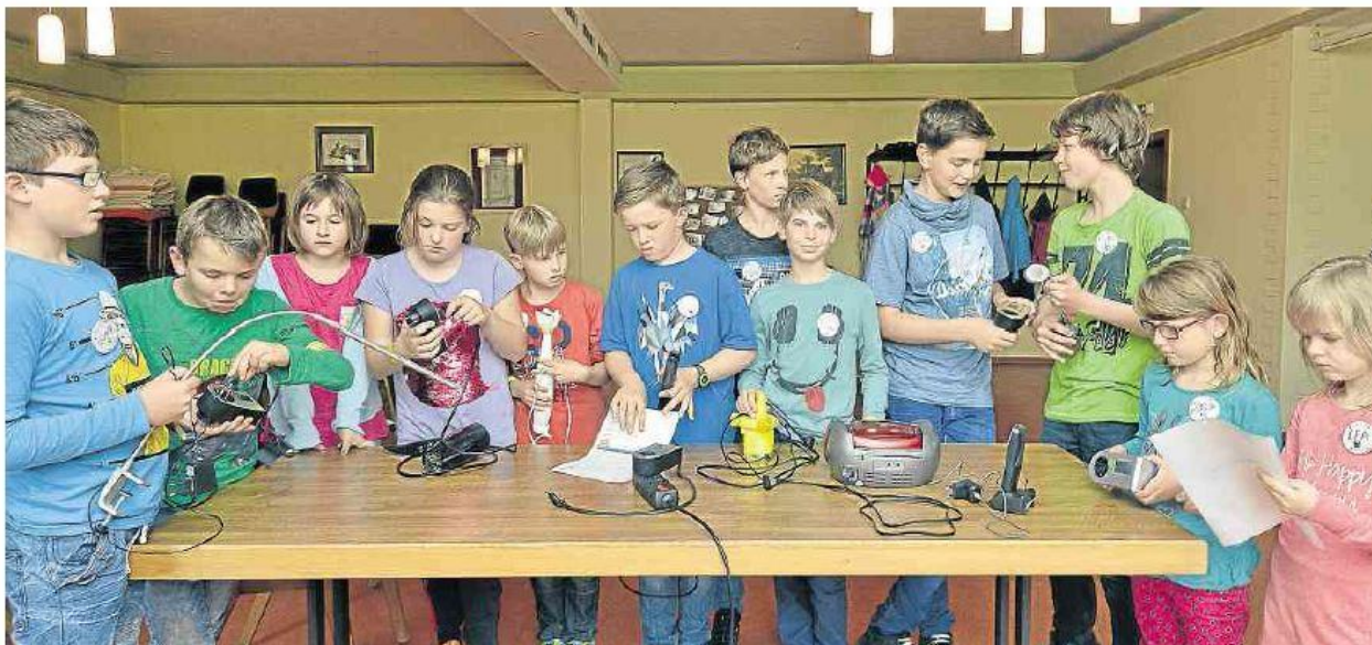
Die Detektive sind los: In Schnorbach zeigen sie den (allzu) verschwenderischen Umgang mit Strom auf, indem sie genau analysieren, welches Gerät wie viel verbraucht.

Zusätzlich plant die Gemeinde selbst einige Maßnahmen, wie den Bau einer Photovoltaikanlage mit Batteriespeicher für die Straßenbeleuchtung sowie die Teilversorgung der Nachtspeicherheizung im Gemeindehaus und Umstellung der Straßenbeleuchtung auf LED-Technik. Auch hierbei berät die Energieagentur.