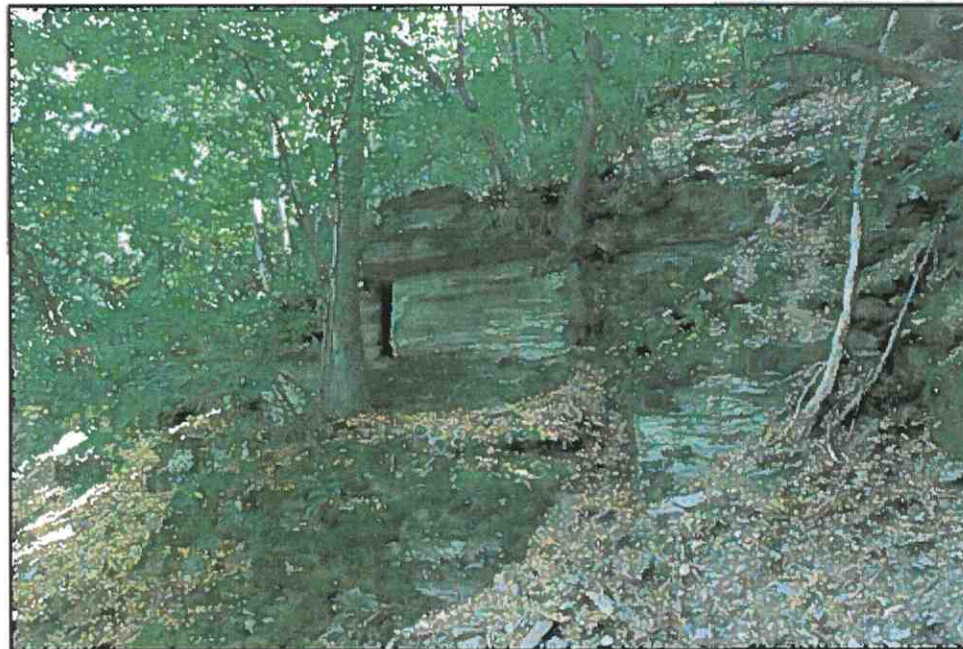
Detailfoto von Abschnitt B, Verkippter Großblock, an den orthogonal zueinander verlaufenden Trennflächen ist der Großblock in mehrere kleiner Blöcke zerteilt, einzelne Blöcke mit Kantenlängen im unteren Meter-Bereich, Aufweitung der Trennflächen durch Wurzeldruck