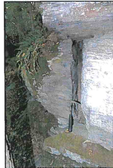
Detailfoto von Abschnitt B, Trennflächen sind im unteren Dezimeter-Bereich geöffnet