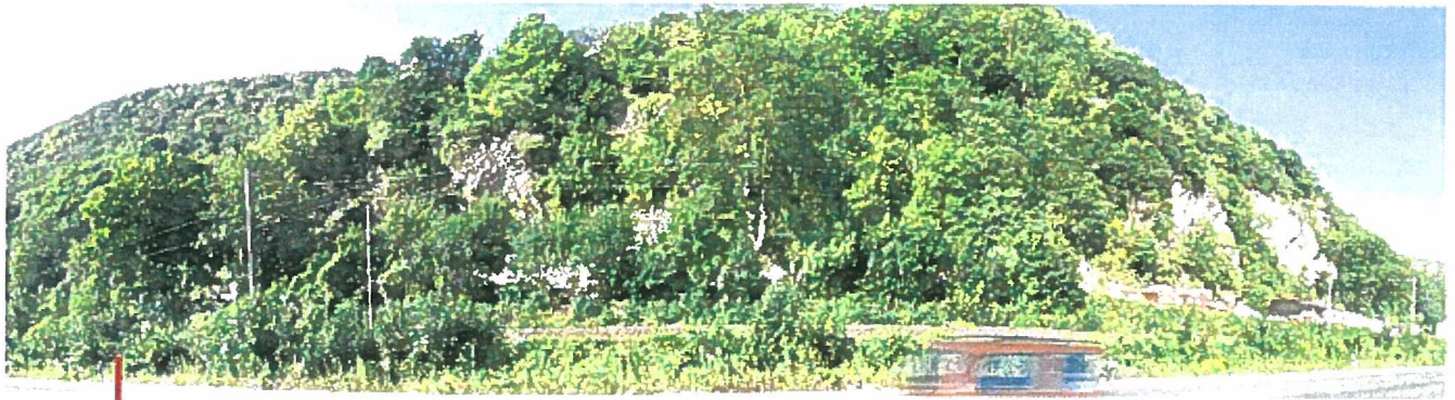
Panoramafoto von Abschnitt A, zwischen dem Hangfuß und den Gleisanlagen befinden sich städtische und private Grundstücke, ausbrechende Steine erreichen nicht das Gleis