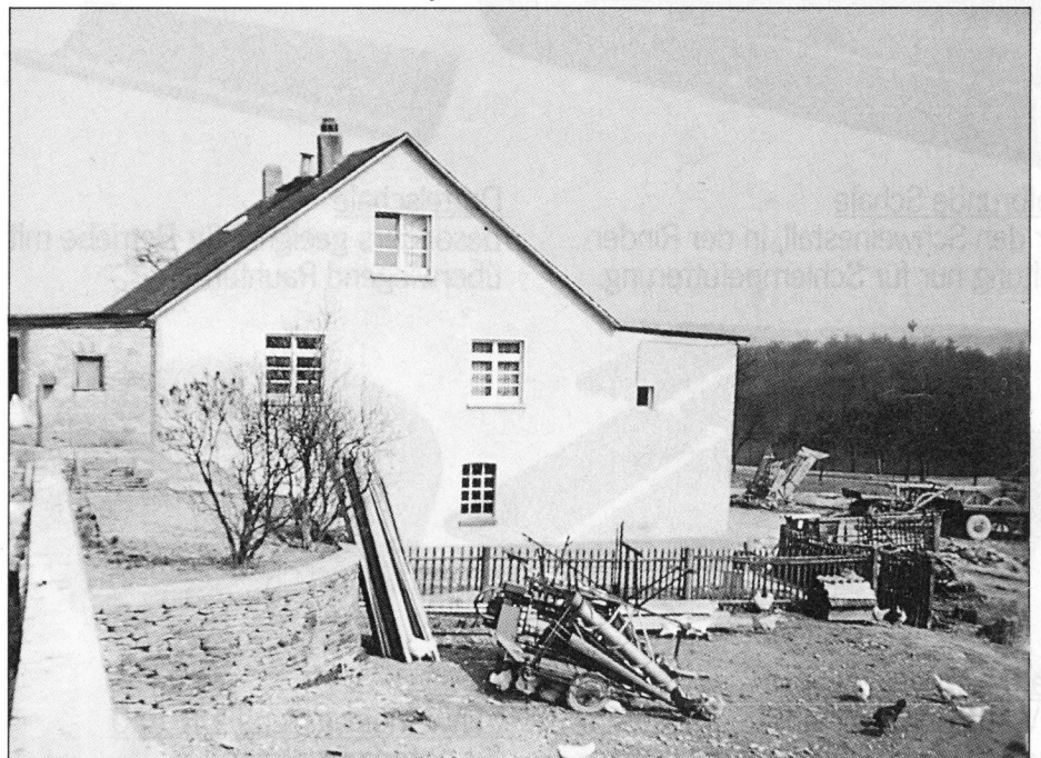
Der alte Hof im August 1959.

1947 erhielt ich von der Höhengemeinde Welterod im Taunus einen Pachtvertrag über 5 ha Ödland. Eine Wildnis von hohem, geschlossenem Heidekraut, Ginster- und Wacholdersträuchern sowie meterhohen Dornenhecken. Ein ausgesprochenes Waldrandgebiet, 3 km vom Dorf entfernt, das die Bauern wegen des hohen Wildschadens nicht mehr bebaut haben. Dazu das Fehlen jeglicher Behausung: kein Strom, kein Wasser, keine Zufahrten.