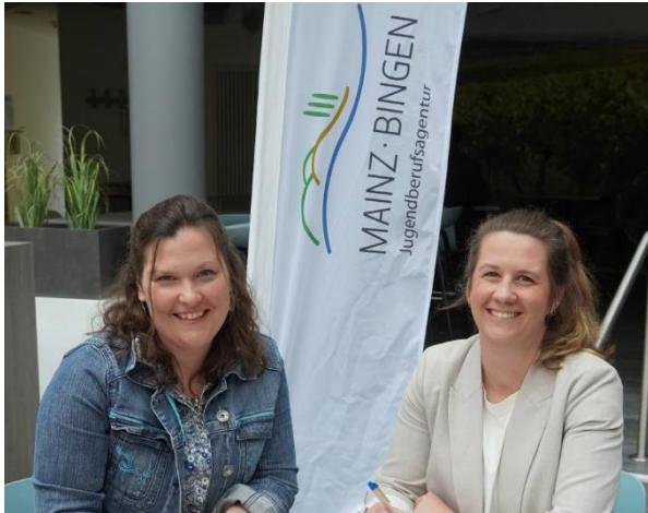
KV Mainz-Bingen / D. Emrich

Damit das Ganze auch gut funktioniert, gibt es im Landkreis noch die Koordinierungsstelle, die für eine gute Zusammenarbeit und Vernetzung sorgt.