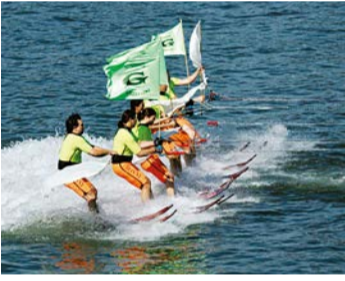
Wassenski auf dem Rhein

Wochenmarkt um den mächtigen Dom einfach an der offenen und heiteren Lebensart der Mainzer. Erleben Sie, wie dort und in den verwinkelten Gässchen der Innenstadt wie schon im Mittelalter das Leben pulsiert. Hinter Rokoko-Fassaden und in bürgerlichen Barockhäusern verbergen sich charmante Cafés und Boutiquen. In der liebevoll restaurierten Altstadt mit ihren vielen Fachwerkhäusern laden Weinstuben auf einen Schoppen ein. Mainz hat viel zu bieten. Sehen Sie selbst und (er-)leben Sie unsere Stadt. Wir hoffen, dass Ihnen dieser Stadtplan bei allen Fragen rund um Ihren Besuch eine Hilfe ist und wünschen Ihnen viel Vergnügen!