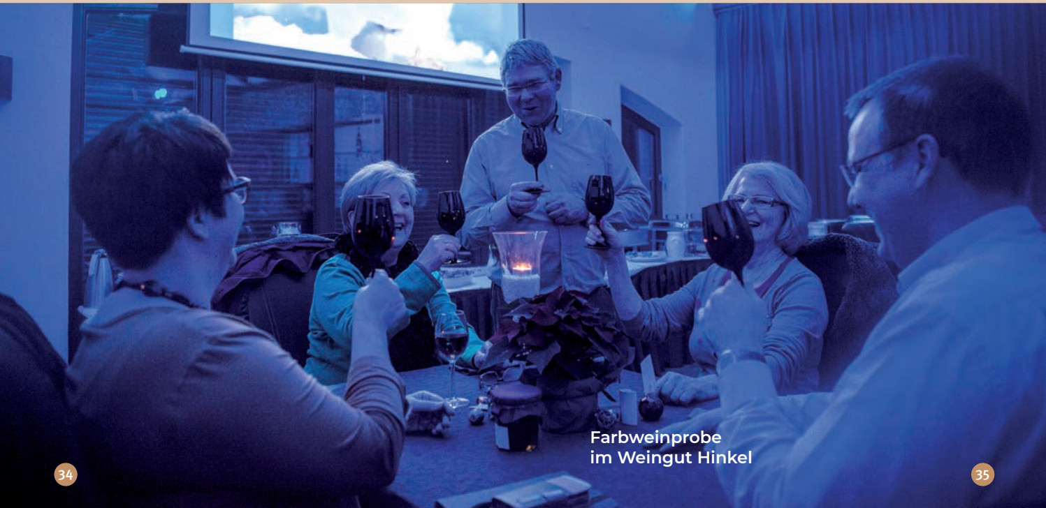
Farbweinprobe im Weingut Hinkel

Klein-Winternheimer-Weg 6 55129 Mainz-Hechtsheim Telefon 06131 59678 www.schneider-weingut.com > Nachhaltigkeit im Weintourismus