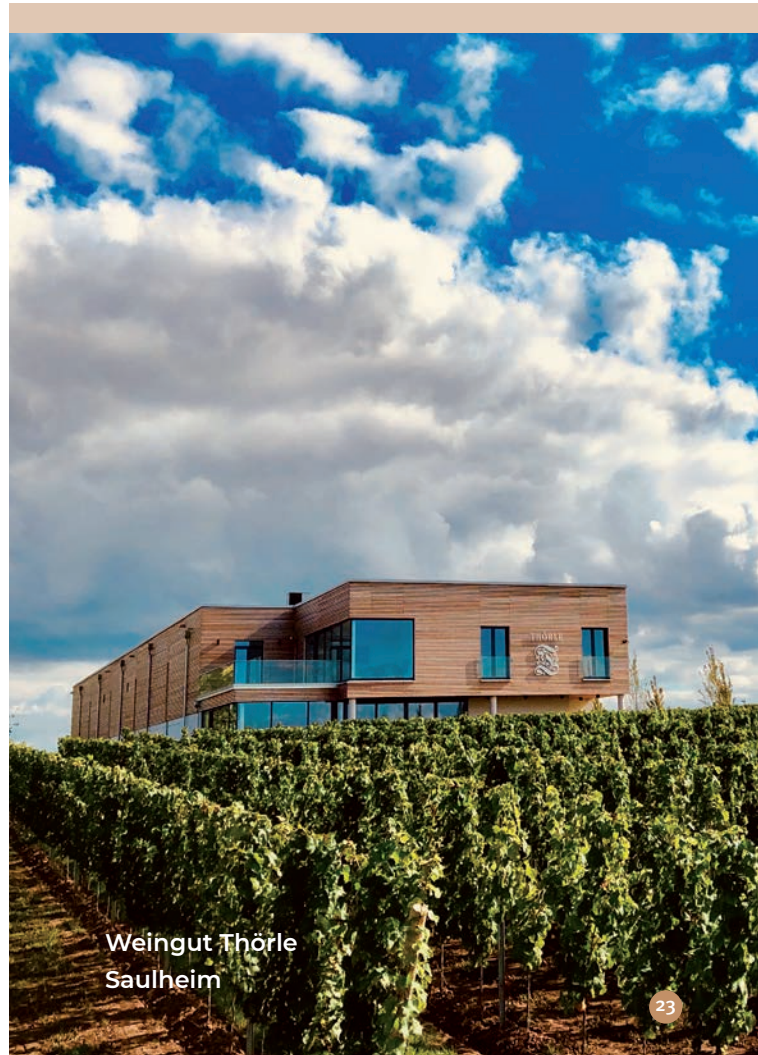
Weingut Thörle Saulheim

Untere Klinggasse 4 67595 Bechtheim Telefon 06242 2425 www.dreissigacker-wein.de > Nachhaltigkeit im Weintourismus