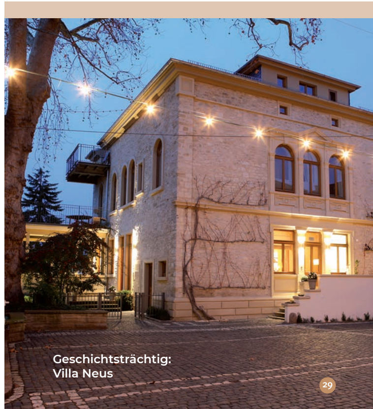
Geschichtsträchtig: Villa Neus

Hauptstraße 38 | 67591 Wachenheim Telefon 06243 8610 www.westwind-weine.de > Nachhaltigkeit im Weintourismus