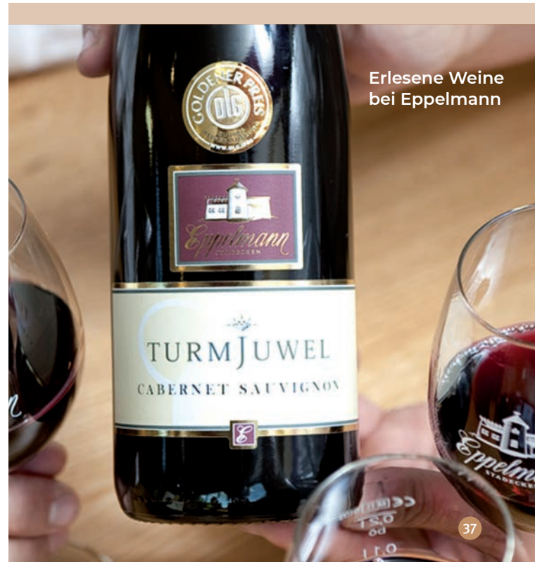
Erlesene Weine bei Eppelmann

Ockenheimer Chaussee 12 55411 Bingen-Büdesheim Telefon 06721 45672 www.weingut-hildegardishof.de > Weingastronomie