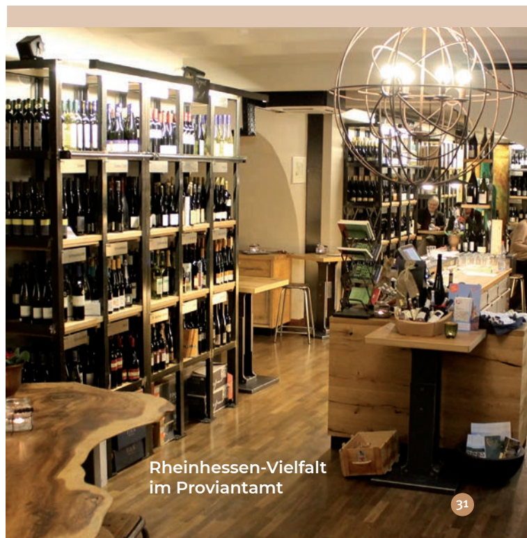
Rheinhessen-Vielfalt im Proviantamt

Hundertguldenmühle/Mühle 2 | 55437 Appenheim Telefon 06725 9990210 www.100guldenmuehle.de > Nachhaltigkeit im Weintourismus