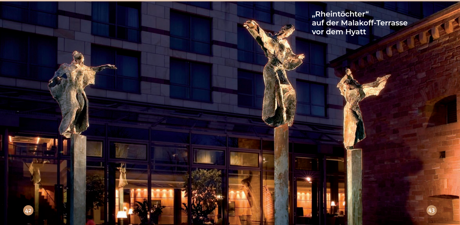
„Rheintöchter“ auf der Malakoff-Terrasse vor dem Hyatt

Weingut, Gästehaus und Kräuterhof Langgasse 41 | 55234 Flornborn Telefon 06735 960085 www.bernhardsraeder.de > Architektur, Parks und Gärten