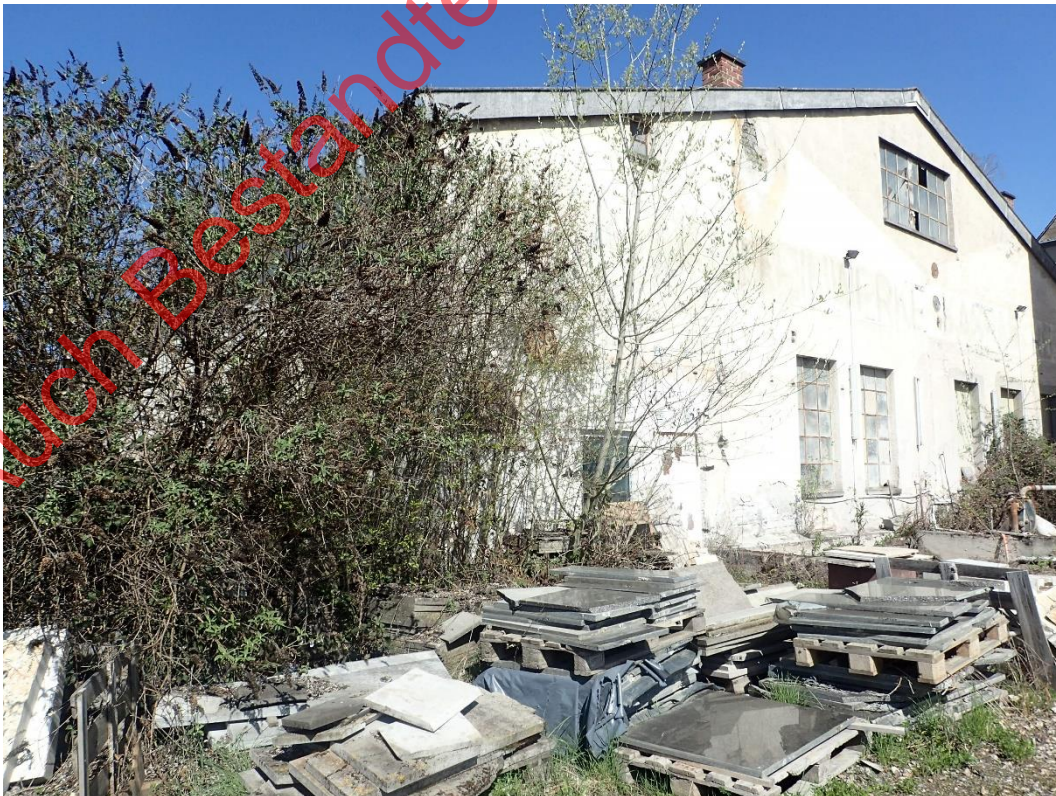
Bild 02: Das abzureißende Gebäude im nördlichen Gebäude mit Schmetterlingsflieder