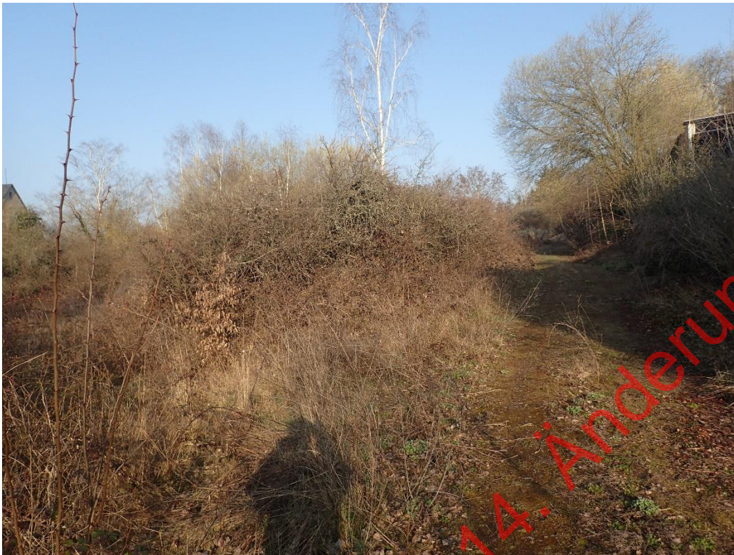
Bild 11: Die nordöstliche Fläche bildet ein störungsarmes Gebiet für Halboffenland-Besiedler