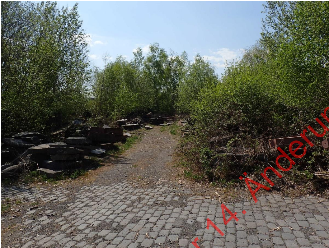
Bild 05: In Randbereichen der Lagerflächen sind Vorwälder entwickelt