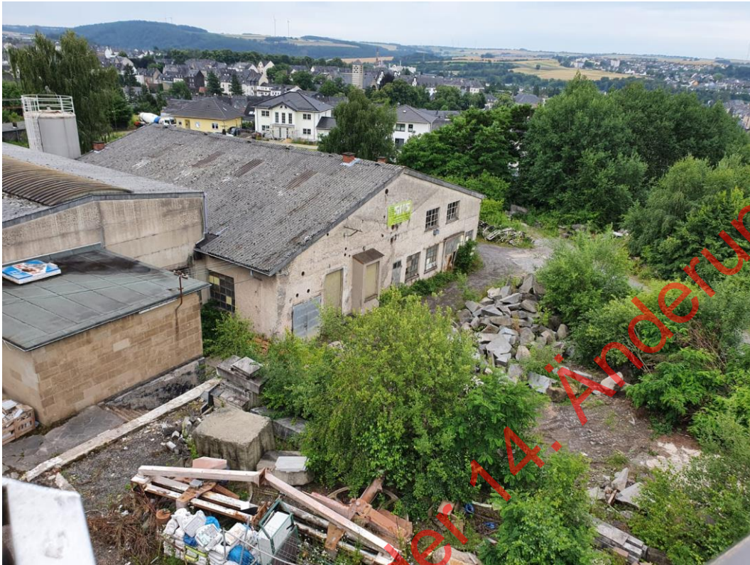
Bild 01: Blick auf den nördlich gelegenen Gebäudekomplex vom Hubsteiger