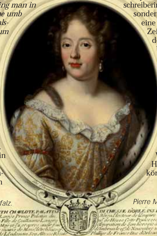
Elisabeth Charlotte (Liselotte) von der Pfalz.

eine der produktivsten Briefeschreiberinnen ihrer Epoche, sondern sicherlich auch eine der wichtigsten Zeitzeuginnen aus dem persönlichen Umfeld des französischen Herrschers Ludwig XIV. Doch welche Umstände haben eine calvinistische Prinzessin aus der Kurpfalz und Enkelin des „Winterkönigs“ Friedrich V. nach Versailles an den Hof des Sonnenkönigs verschlagen?