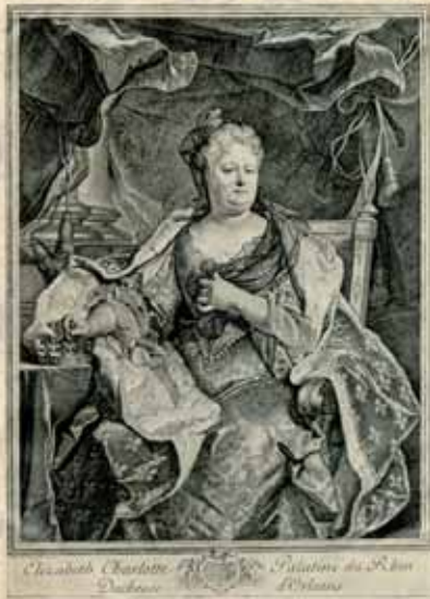
Madame als Witwe. Kupferstich von Marie Horthemels nach H. Rigaud.*

auf den Plan, der im Namen seiner Schwägerin Liselotte Ansprüche auf kurpfälzische Gebiete, die Herrschaft Simmern, die Grafschaft Sponheim und die pfälzischen Oberämter Germersheim und Lautern erhob. Es wurde aber sehr schnell deutlich, dass diese Erbansprüche nur der willkommene Vorwand waren,