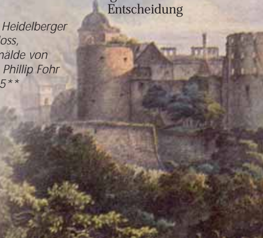
Das Heidelberger Schloss, Gemälde von Carl Phillip Fohr 1815**