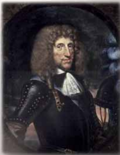
Kurfürst Karl I. Ludwig von der Pfalz. Gemälde von Johann Baptist Ruell. *

Damit war der Weg frei für eine Rückkehr Liselottes an den Heidelberger Hof. Trotz der Trennung von den Eltern und ihrem Bruder hatte die temperamentvolle Liselotte das unbeschwerte Leben bei ihren Verwandten in Hannover genossen. Zeitlebens sollte Sophie, die spätere Kurfürstin von Hannover, die wichtigste Vertrauensperson ihrer Nichte bleiben. Tausende Briefe wechselten die beiden Frauen bis zum Tode der Kurfürstin 1714.