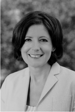
Ministerpräsidentin Malu Dreyer

Grundgesetz und Landesverfassung regeln die rechtliche Grundordnung des Staates und schreiben das Wertefundament unseres Gemeinwesens fest. In der Verfassung als höchster Rechtsnorm werden die Leitprinzipien bestimmt, nach denen staatliche Macht ausgeübt werden darf, etwa das Demokratie- und Rechtsstaatsprinzip. Sie hat die grundlegenden gesellschaftlichen Wertentscheidungen zu treffen, beispielsweise die Unantastbarkeit der Würde des Menschen.