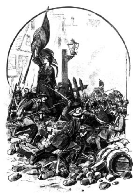
Rückzugsgefecht bei Kirchheimbolanden.

14. - 16. Juni 1849: Niederlagen der pfälzischen und rheinhessischen Freischaren in Kirchheimbolanden, Ludwigshafen und Rinntal.