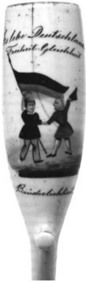
Pfeifenkopf, bemaltes Porzellan, um 1848/49, Originalgröße. Zwei Revolutionäre mit schwarz-rot-goldener Fahne und Aufschrift: „Es lebe Deutschland Freiheit - Gleichheit - Brüderlichkeit“.

Anstelle eines einigen, freien Deutschlands wird die Kleinstaaterei des reaktionären Deutschen Bundes restauriert: Preußen, Bayern, Hessen, Nassau, Oldenburg und das winzige Fürstentum Hessen-Homburg regieren bis 1866 das Land, bis Bismarck den Deutschen Bund zerstört, eine gewisse