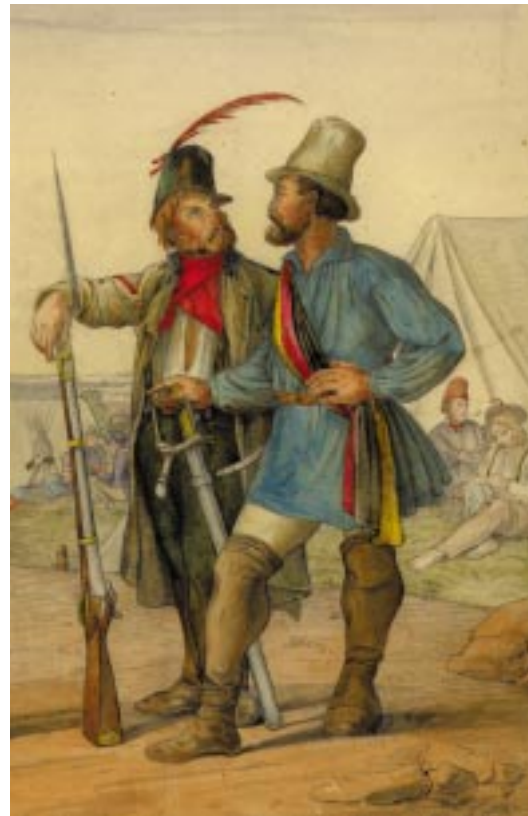
Das Bild zeigt den 1811 in Mainz geborenen Freischarenführer Germain Metternich (rechts) und einen Kampfgefährten aus dem badisch-pfälzischen Aufstand.

Aber es gibt Besonderheiten der Revolution im rheinisch-pfälzischen Raum. Dazu gehören: