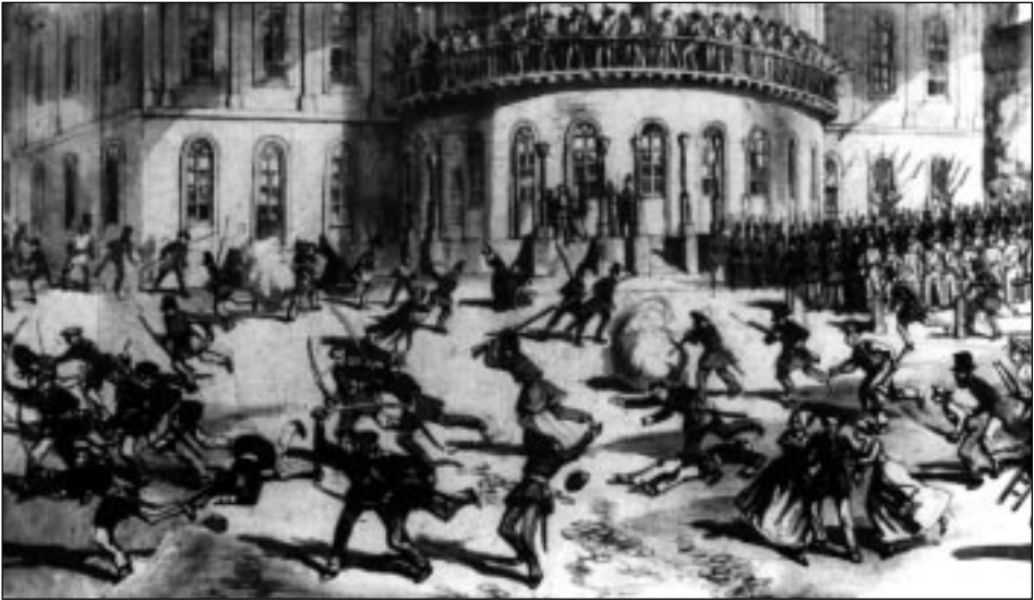
Vor dem Mainzer Theater: Verfolgung der preußischen Soldaten nach dem Sturm auf die Bürgerwehr am 21. Mai 1848.

29. Juni 1848: Die Nationalversammlung wählt Erzherzog Johann von Österreich zum Reichsverweser.