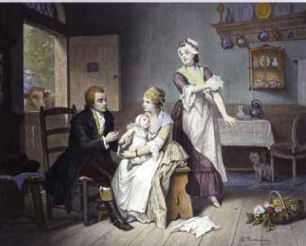
Edward Jenner impft sein kleines Kind, das von seiner Frau gehalten wird

Tatsächlich waren die Erfolge beachtlich; die Geimpften schienen ebenfalls geschützt, die Nebenwirkungen hingegen weitaus geringer als bei der Variolation. Dennoch stieß die neue Methode auf einige, auch politische Hindernisse, wie etwa im rhein-