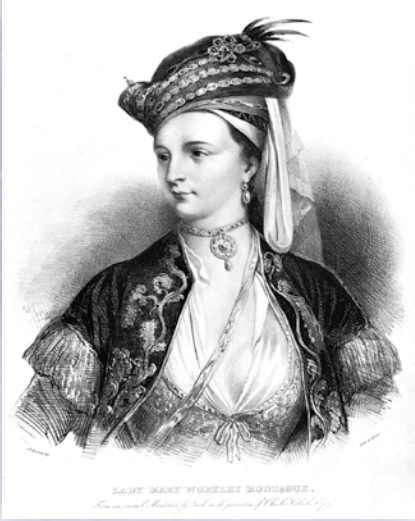
Portrait von Lady Mary Wortley Montagu

variola für „Pocken“. Dabei handelte es sich jedoch keinesfalls um ein neues Vorgehen. Vermutlich schon seit Jahrhunderten war die Variolation in der Volksmedizin des Nahen Ostens und in Zentralasien bekannt und verbreitet gewesen. Von dort brachte sie 1721 die Ehefrau des britischen Botschafters in Konstantinopel, Lady Mary Wortley Montagu, mit nach Europa.