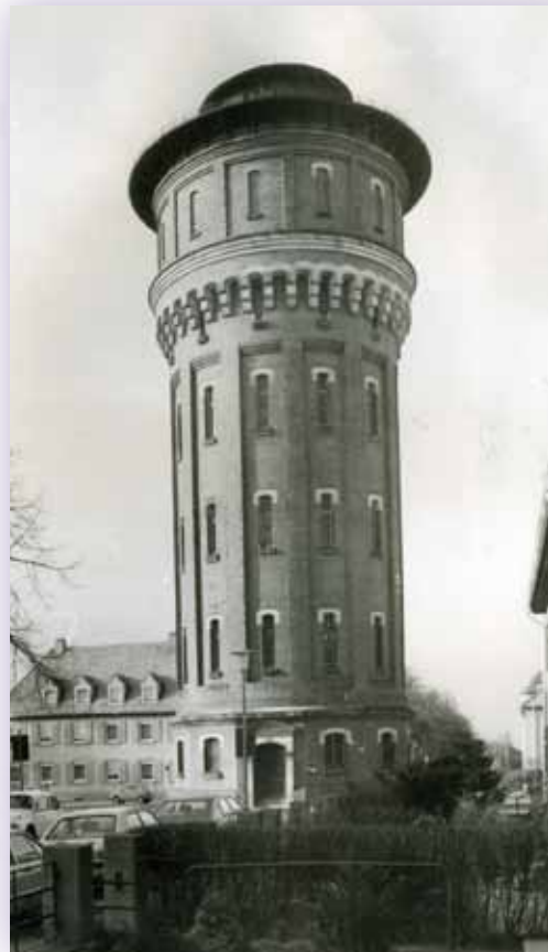
Der Speyerer Wasserturm

Dagegen stellt die Cholera noch heute eine große Bedrohung vor allem für die Menschen des sogenannten globalen Südens dar. Nach einem sechsten epidemischen Ausbruch Anfang des 20. Jahrhunderts befinden wir uns seit den 1960er Jahren in der siebten Pandemiewelle. Damit ist die Cholera die weltweit am längsten andauernde Pandemie, die immer noch jährlich mehrere Millionen Infektionsfälle hervorruft und zehntausende Todesfälle fordert.