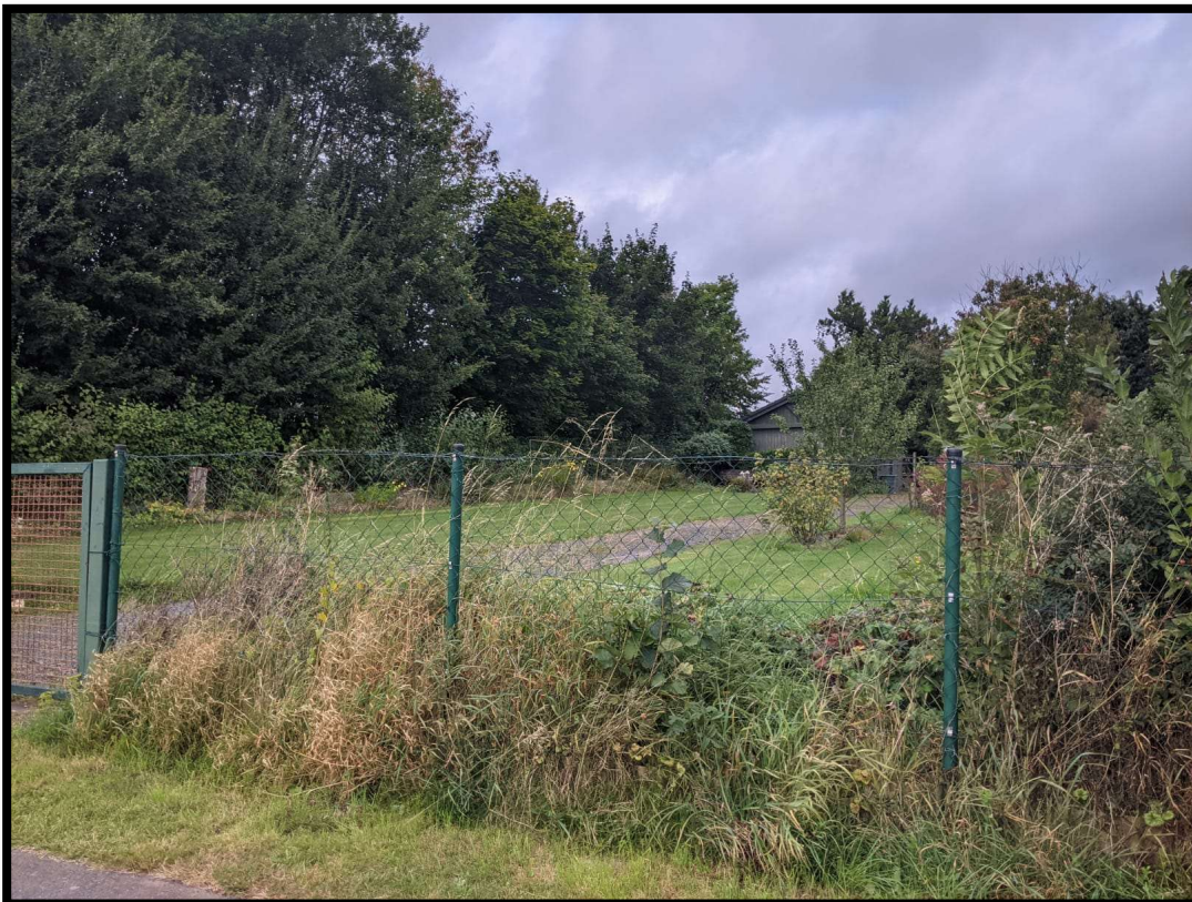
Abbildung 3: Nördlicher Abschnitt des Plangebietes.