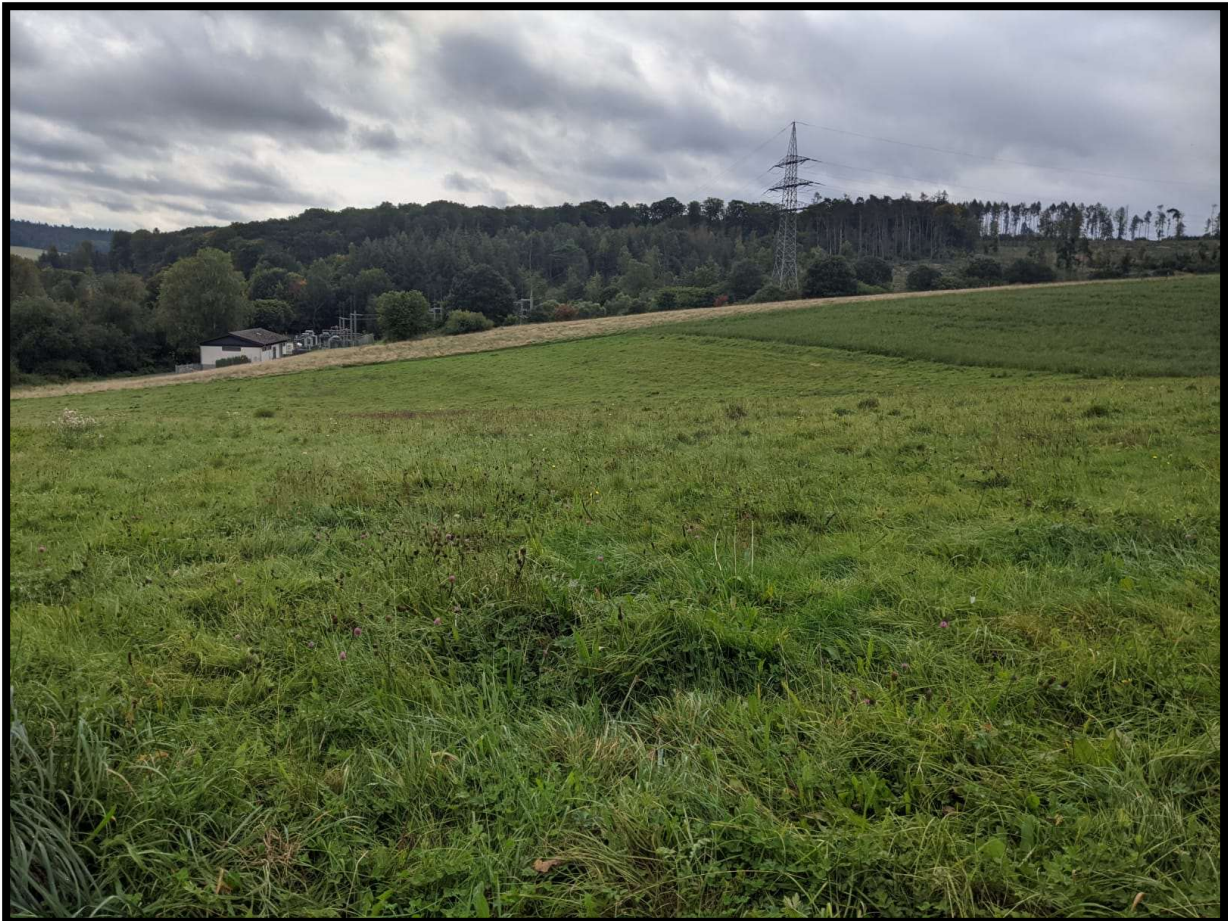
Abbildung 5: Mähwiese im südlichen Teil der Planfläche.

Nach Osten hin wird die Fläche durch eine rund 3 m hohe Thuja-Hecke von der angrenzenden Bebauung getrennt, ansonsten liegen keine weiteren Strukturen im Umfeld der Teilfläche.