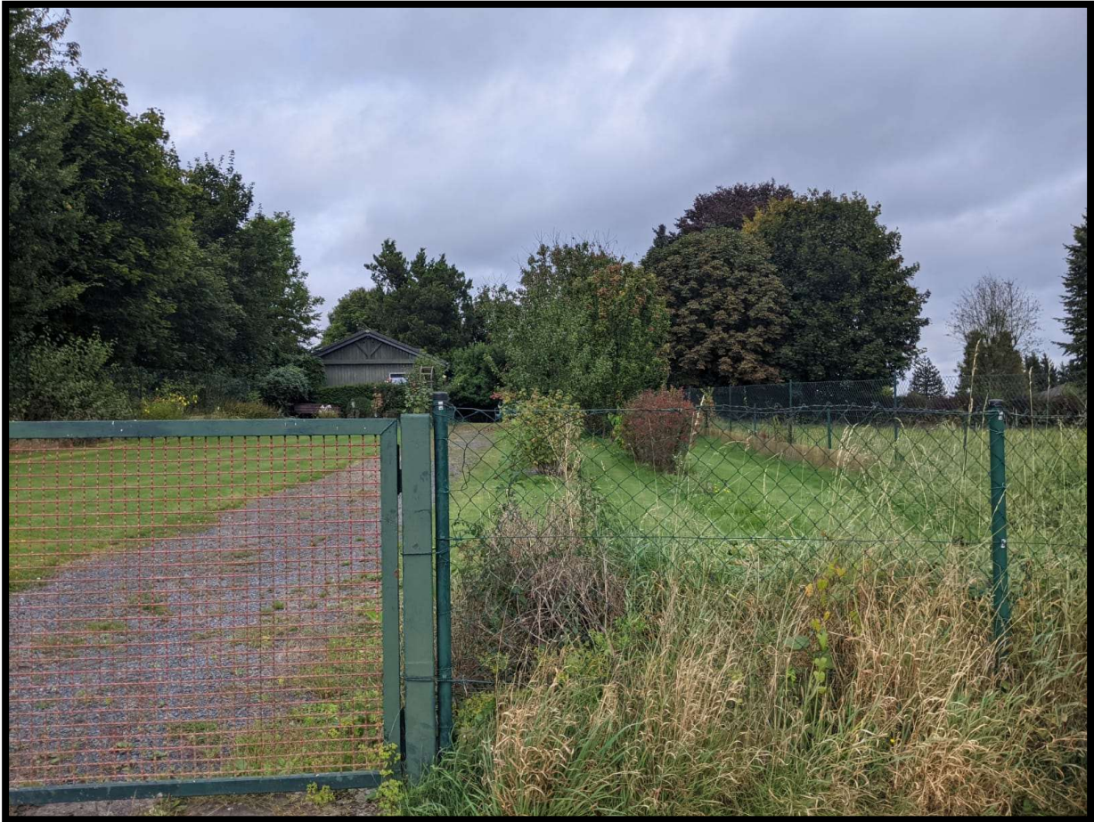
Abbildung 6: Als Garten genutzter Teilabschnitt der Planfläche (nördlicher Abschnitt).

ebenfalls einen sehr offenen Charakter auf. Nach Norden hin grenzen weitere Gärten an, östlich befindet sich Grünland und unmittelbar westlich grenzt ein Gehölzbestand mittleren Alters mit Eichen und weiteren Laubbaumarten an. Dieser bleibt im Zuge der Planumsetzung vollständig erhalten.