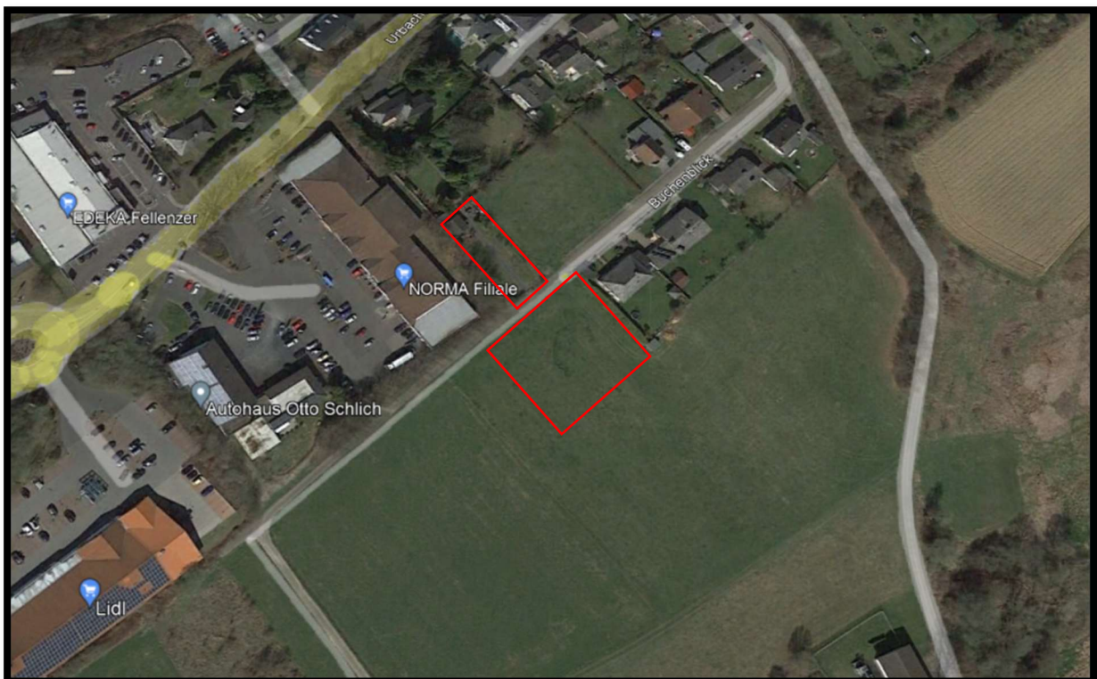
Abbildung 1: Abgrenzung des Plangebiets (rote Umrandung).

Das Plangebiet liegt im Süden/Südwesten der Ortschaft Puderbach auf beiden Seiten der Straße „Buchenblick“ (Abb. 1).