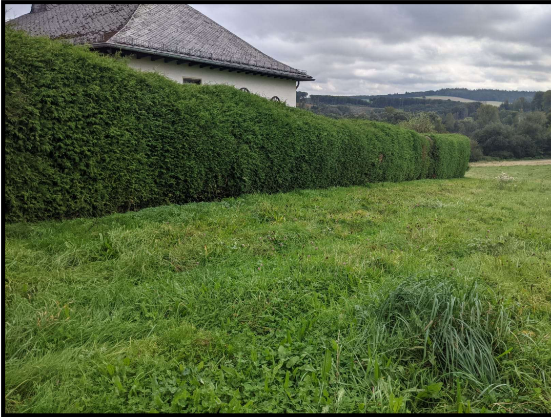
Abbildung 2: Südlicher Abschnitt des Plangebietes.