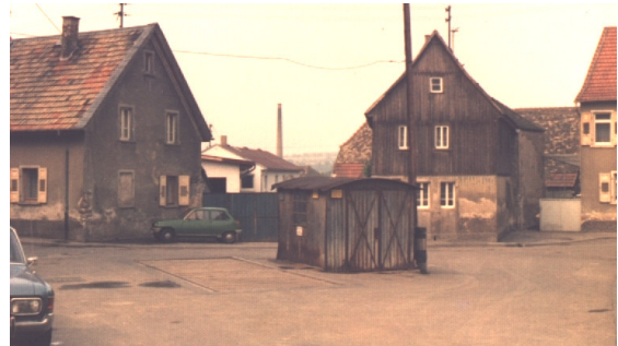
1973, das ehemalige Wiegehäuschen auf dem heutigen Receyplatz. 2

Im notleidenden Mainz wurden damals etliche Hungermärsche in das rheinhessische Hinterland organisiert, um dort Wertgegenstände gegen Lebensmittel einzutauschen. Irgendwann kam auch eine kommunistische Gliederung nach Nieder-Olm. Eine Schalmeienkapelle ging dem Zug voran. Auf dem freien Platz, heute Recey-Platz, wurden unter viel Beifall vom Dach des alten Wiegehäuschens flammende und engagierte Ansprachen gehalten.