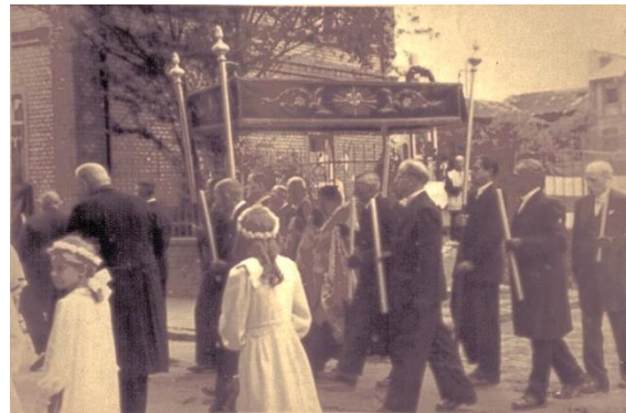
1925, Fronleichnamsprozession, mit Baldachin, auch Himmel genannt, über dem Allerheiligsten, der Monstranz. 7