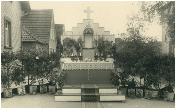
1950er Jahre, Straßenaltar zur Fronleichnamsprozession, Ecke Ernst-Ludwig Straße – Heinrichstraße. 12

Stationen der Fronleichnamsprozessionen fanden auch an den innerörtlichen alten Straßenkreuzen statt.