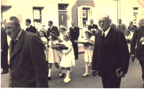
Juni 1949 Fronleichnamsprozession in der Pariser Straße. 11