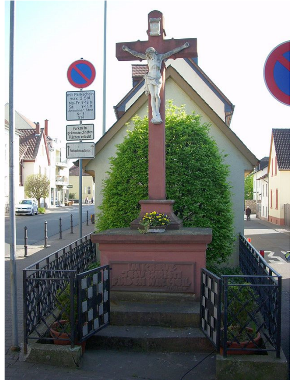
Straßenkreuz Oppenheimer Straße – Wilhelm Holzamer Weg. 14