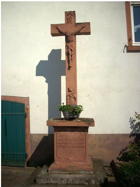
Straßenkreuz in der Pfarrgasse. 13

Stationen der Fronleichnamsprozessionen fanden auch an den innerörtlichen alten Straßenkreuzen statt.