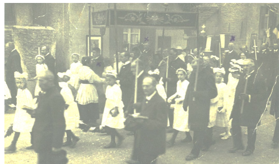
1930er Jahre, Fronleichnamsprozession. 8