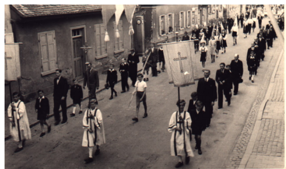
Juni 1949 Fronleichnamsprozession in der Pariser Straße. 10