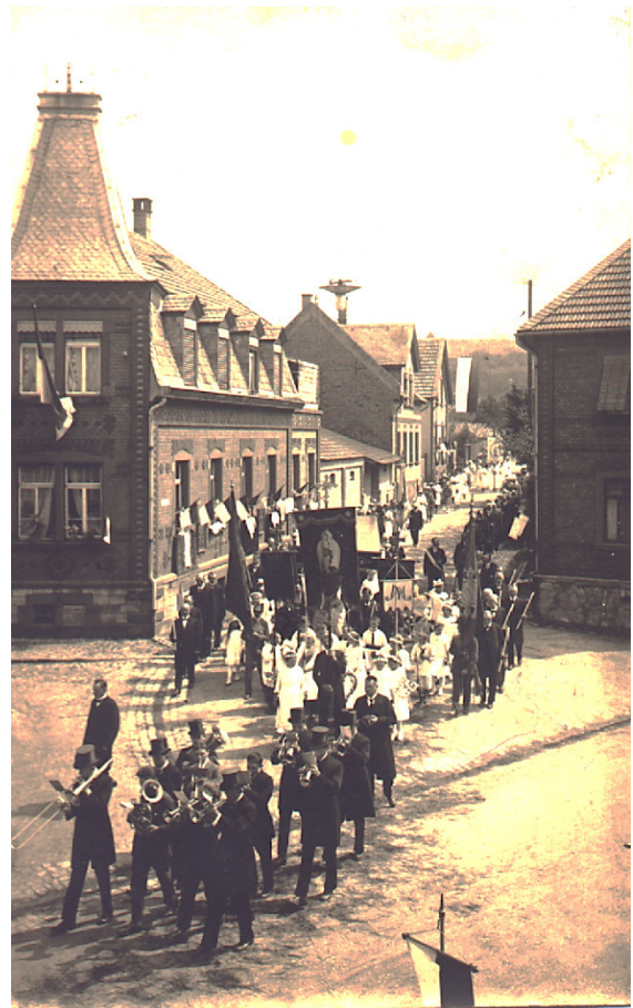
1925, Fronleichnamsprozession, Ecke Wallstraße-Bahnhofstraße. 6

seitlich durch alte Hollerbüschle verdeckt werden, und nun zieht sie weiter hinaus ins Freie zu dem Heiligenhäuschen, das durch Fahnen und Blumen und Baumgrün heute zu einer richtigen Kapelle erweitert ist und stolz in seiner Wichtigkeit dasteht. 5 Der Gesang und die Musik verlieren sich nun in der Weite, aber die Glockentöne ziehen von der Stadt her reiner und klarer über die Prozession hin. Es ist alles von Lobpreisung und Herrlichkeit erfüllt.