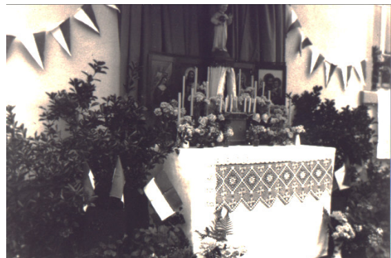
1933, Straßenaltar zur Fronleichnamsprozession. 9