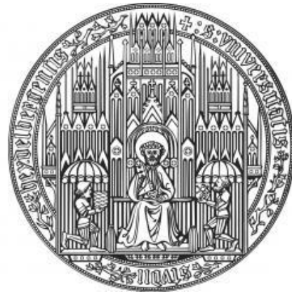
Siegel der Universität Heidelberg. 11