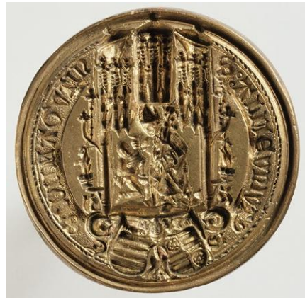
Siegel der Universität Mainz, um 1477. 4

Universität Mainz zu finden, das er dann an der Universität Heidelberg fortsetzte. 3