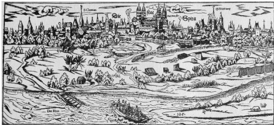
1500, Stadtansicht von Speyer nach Sebastian Münster. 8