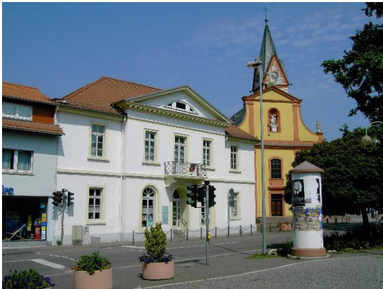
Das alte Rathaus von 1827.

Mit Beginn der großherzoglich-hessischen Zeit ab 1816 begannen langjährige Bemühungen des Gemeinderats zur Errichtung eines neuen Rathauses. Die Gemeinderatssitzungen fanden in dieser Zeit wechselnd in einem der Gaststätten mit Saalbau statt. Es sollte bis 1827 dauern bis ein neues Rathausgebäude endlich realisiert werden konnte. Der Neubau des Rathauses an der Pariser Straße im klassizistischen Baustil entstand vermutlich nach der Planung des hessischen Landbau-meisters Friedrich Schneider, der in den 1820er und 1830er Jahren in der Provinz Rhein Hessen aktiv war.