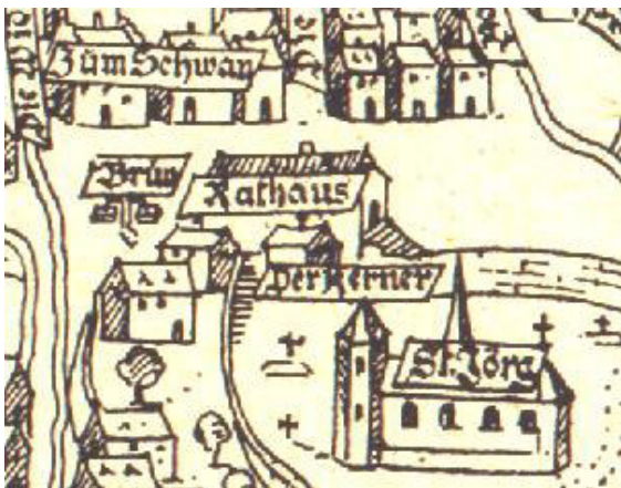
1577, das erstmals 1492 erwähnte mittelalterliche "Clafhus", das Rathaus, an der Ecke Pariser Straße-Backhausstraße.

Ab 1492 wird das mittelalterliche Rathaus als festes Bauwerk genannt, das sich an der Ecke Pariser Straße – Backhausstraße befand, wie es im Ortslageplan von 1557 des Topographen Gottfried Mascop zu finden ist.