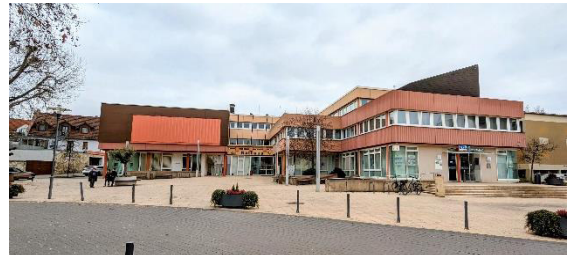
Das 1977 neu gebaute Rathaus für die Verbandsgemeinde- und Stadtverwaltung Nieder-Olm.

Zwischen 1965 und 1972 kam es in Rheinland-Pfalz zu einer Funktions- und Gebietsreform mit dem Ziel zur Einrichtung von Verbandsgemeinden. In Nieder-Olm wurde 1972 so die Verbandsgemeinde Nieder-Olm mit sieben Gliedgemeinden gegründet. Zunächst war deren Verwaltungssitz noch im alten Rathaus angesiedelt, bis man 1974 mit dem Bau eines neuen Rathauses in der Stadtmitte begann, das 1977 bezogen wurde. Neben der Verbandsgemeindeverwaltung etablierte sich dort nun auch die Gemeindeverwaltung, seit 2006 Stadtverwaltung, von Nieder-Olm.